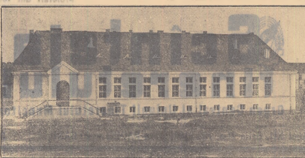
Elevii școlilor profesionale, care formează schimb de miine al muncitorilor din industrie se bucură de condiții tot mai bune pentru a-și însuși și desăvîrși calificarea.

Venețianov este primul care a renunțat la tablourile pompoase ce se creaseră pînă atunci, redînd în pinzele sale viața obișnuită, oamenilor simpli, Rusia adevărată. Apoi, spre sfîrșitul veacului trecut, influența de mișcare revoluționară o serie de pictori pun bază unei noi orientări, realiste, populare, arătîndu-și simpatia pentru viața poporului, demascînd ortoducerea socială asupritoare. În