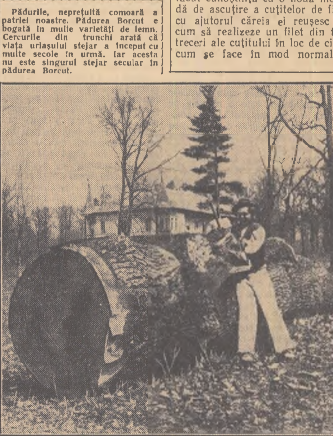
Pădurile, nepreluță comoră a patriei noastre. Pădurea Borcut e bogată în multe varietăți de lemni. Curcile din trunchi arată că viața urșului stăjer a început cu multe secole în urmă, iar acesta nu este singurul stejar secular în pădurea Borcut.