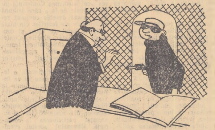
11 Casierul: E prea tîrziu, domnule, casa se închide la ora 4. (din „VIE NUOVE”)