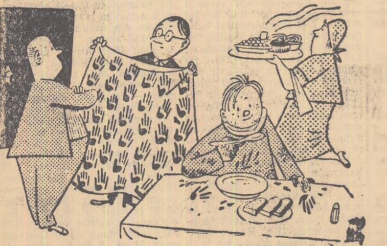
5 Eu cred că pentru un asemenea om ar trebui un asemenea model de față de masă, tovarășe ospătar!