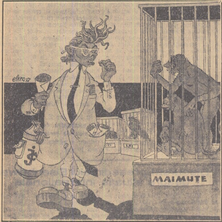
2 Maimuța: Ha, ha, ha! ce părere ai de „maimuțoiul”, ăsta?