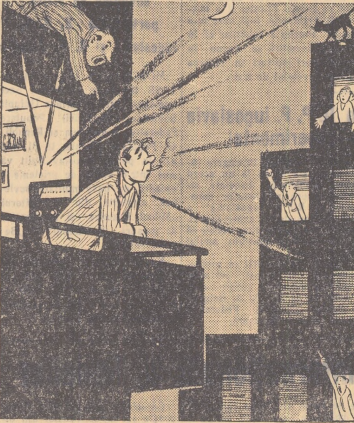
10 Unii cetățeni, lăsînd aparatele lor de radio să urle noaptea tîrziu, manifestă dispreț față de odihna altora