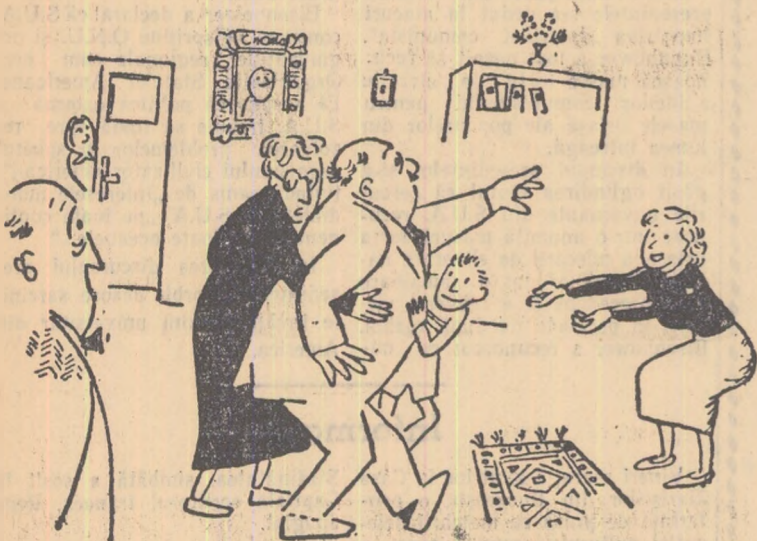
3 — N-are nimic. A fost destituit din funcția de director și învăță din nou să umble pe jos...