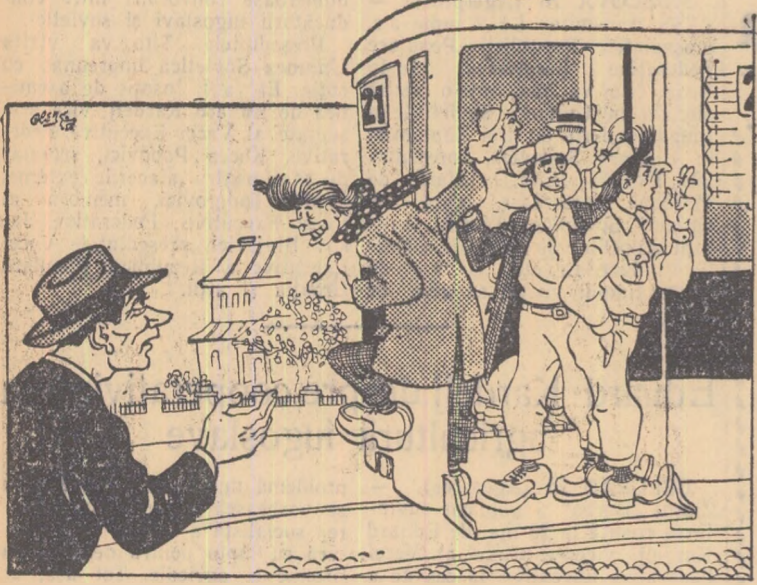
1 — Măi flăcăi, intrați înăuntru. Nu mai călătoriți pe scară e și primejdios. — Te înșeli. Primejdia cea mare e înăuntru: taxatorul!