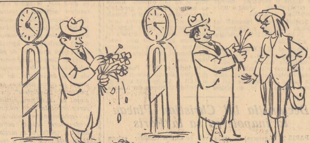
8 — VINE, NU VINE, VINE, NU VINE...