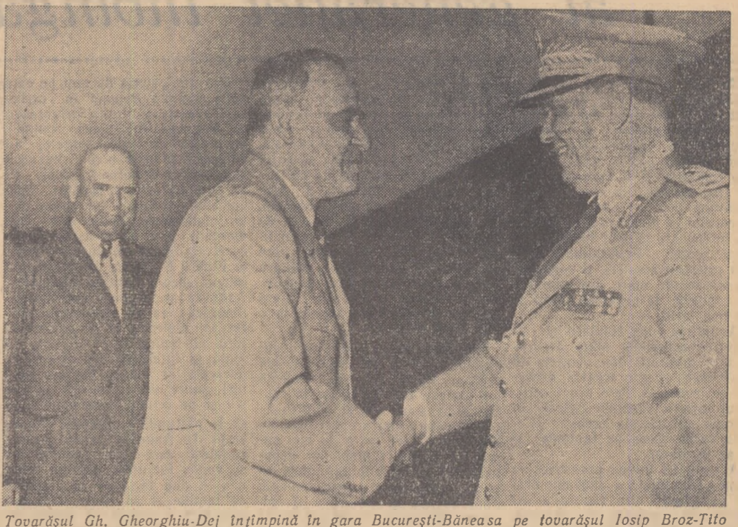
Tovarășul Gh. Gheorghiu-Dej întîmpinînd în gara București-Băneasa pe tovarășul Iosip Broz-Tito