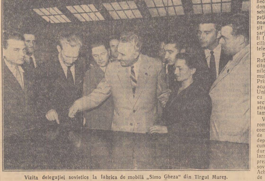
Vizita delegației sovietice la fabrica de mobilă „Simo Gheza” din Tîrgul Mureș.