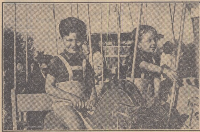
O călătorie vjeiloasă cu avionul sau cu călușii produce copilul bucurii neasemuite. Și copilul trebuie să le dăruiască numai bucurii și fericele.

CITIȚI ÎN PAGINA III-A, MATERIALE ÎNCHEINATE ZILEI INTERNAȚIONALE A COPILULUI.