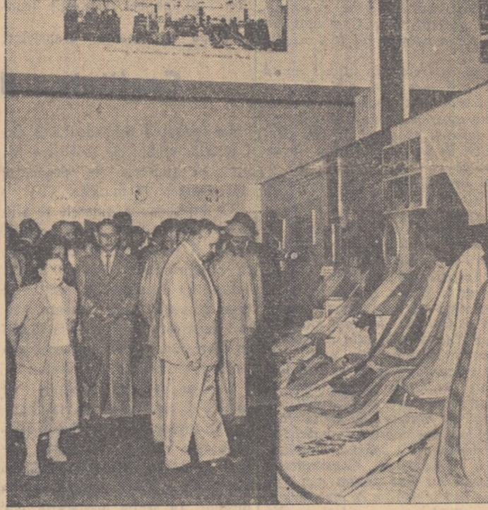
Joi la amiază a avut loc în sala din b-dul Magheru nr. 21, deschiderea expoziției „Republica Populară Romîna pe drumul construirii socialismului”, organizată de Societatea pentru răspîndirea științei și culturii.