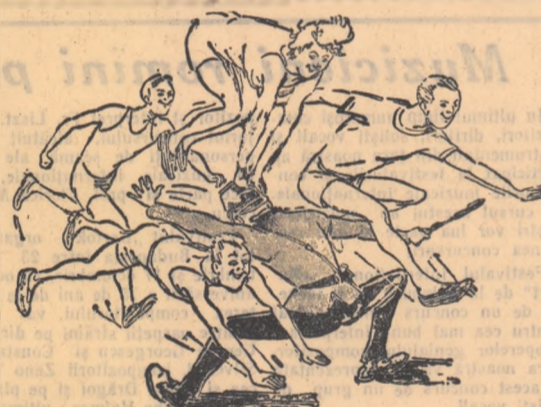
Impotriva ștencelor lui Adenauer, spre Leipzig!