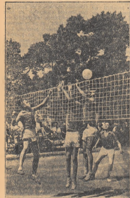
Finala pe Capitală la volei disputată între Locomotiva-Depoul C.F.R. Triaj și Energia I.C.A.R. Intinire câștigată de prima echipă.