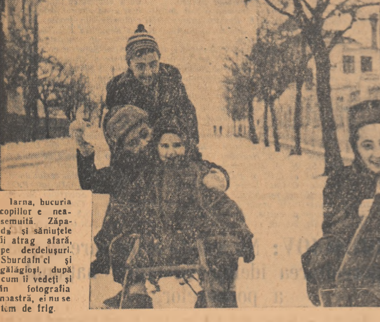
Larna, bucuria copiilor e neasemuită. Zăpada și săniuțele îi atrag afară, pe derdelușuri. Shurdan și gălăgioși, după cum îi vedeți și în fotografia noastră, ei nu se lăm de frig.