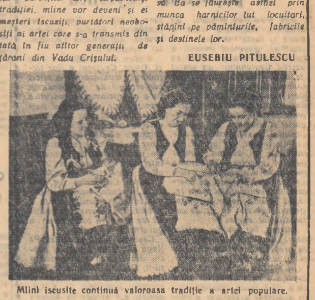
Mîini iscusite continuă valoroasa tradiție a artei populare.