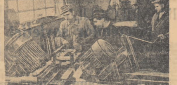
Mobila fabricată la Tileagd este cîntată cu tot mai mult interes.

este mai pîltoștii privilegii din fabricare cît de prețule de oferte. Reșer și sau Huneoarel, atî de necesare constructorilor de locomotive.