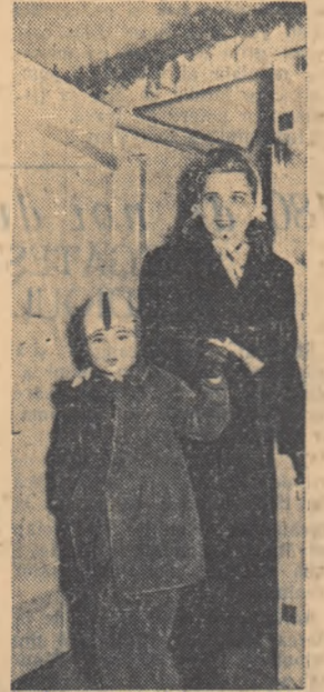
La diferite centre de votare sau pe străzi.

În ziua alegerilor, reporterii noștri au întreprins o anchetă în rîndul cititorilor alegători înținți