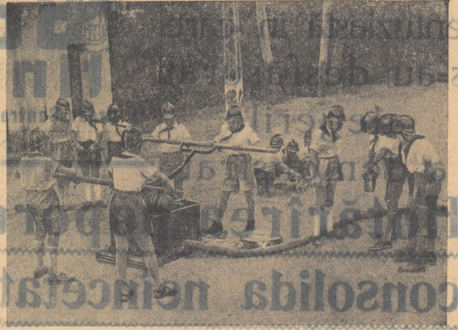
Micii pompieri invata cu sarg minuirea materialelor de lupta contra incendiilor