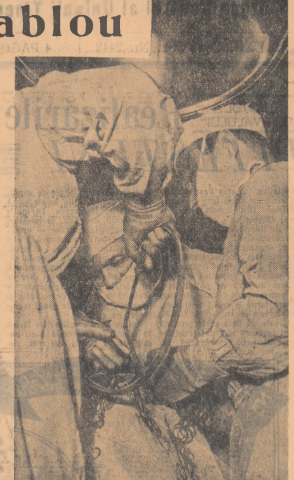
Tumorea a fost extirpată.

Ridicăm privirea: o pereche de teniși albi — izbitor de albi, o pereche de pantaloni de aceeași nuanță și o vestă, desigur, tot albă. Un om mărunț, plin, cu fața rotundă și blajină aștepta răsplată. Aprobăm și interlocurul nostru ne poartă spre „Blocul operator”. Inimile bat, de sparg piepturile... Privim degetele