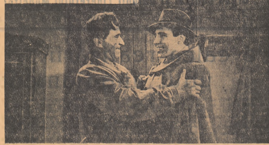
O scenă din film

Întriga se dezvoltă în jurul unei fîrere lemei de la țară care — fugită de-acasă în ziua nunții, spre a scăpa de un soț mîrșă în vîrstă și uric — ajunge la o exploatare forestieră unde odată cu adevărat dragostea, va curmă o viață nouă și demnă. Lucrurile nu evoluează însă liniar, ba dimpotrivă, ele se complică, poate chiar prea mult. Ultragia, soful și dă Anică de urmă și dornic să se răzbune, își face apariția la centrul forestier unde dragostea frumosei lemei este acum disputată de doi buni orienti: șeful de sector Tudor Badale și brigadierul motorist Florinte Damian, dintre care ea li preferă pe cel dintîi. Evident de aci izbucnește scîntia conflictului care ar fi putut avea prețioase valențe dramatice dacă nu i se adăugau o seamă de întîmplări exterioare, neprevăzute legate de primele muncii la Rîpa dracului precum și o acțiune de sabotaj în care este implicat și chiaburul Grigore Bălțai șeful dintîi al Anică. Intîmplări veridice, dar neglate organice de restul acțiunii. După cum se vede e vorba de o urzică dramatică greu de condus și care nici nu a fost stăpînită pînă la capăt de realizatorii filmului (scenarist: Dragoș Violo regizor Jean Mihail). Așa se face că pe parcursul filmului centrul de greutate al conflictului se deplasează. Pe primul plan nu se află dect la început Anica și destul ei — atît de semnificativ pentru ridicarea lemei din patria noastră la un trai liber bucurîndu-se de respectul merit —; treptat devine dominantă drama lui Florinte Damian, care