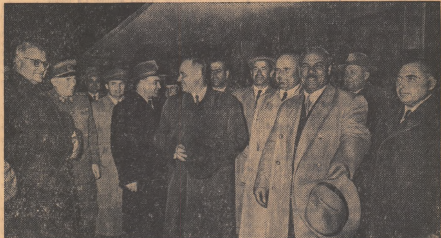
Delegația guvernamentală și de partid a R.P.R. la sosire, în gara Băneasa