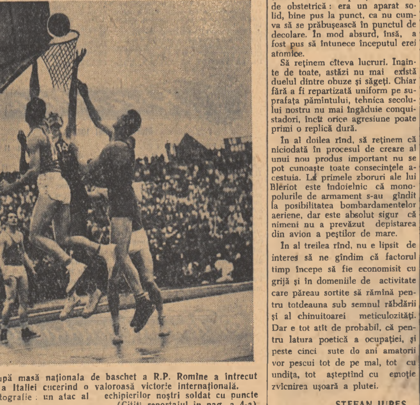
după masă națională de baschet a R.P. Romine a întrecut pe a Italiei cucerind o valoroasă victorie internațională. Fotografie: un atac al echipierilor noștri soldat cu puncte (Citiți reportajul în pag. a 4-a)

ducem niște avioane a căror utilitate începe să fie, între aceea de a semnaliza pescarilor existența bancurilor de peșci. Cu ajutorul unui bun film mentar, vizionat recent, ne face o imagine asupra inurii unei astfel de misiuni. Să înțim, pasărea mecanicreează întinsurile albastre cu atenția comoranzului. Se liniștit, fără grabă, deasurării Negre, împărțită scheș în sectoare și zone piscicole și bine puse la punct. Pare or de agrement, între apă și rar calmul ascunde încordare. Ite de relief ale fundului de împriță suprafeței nuanțe și tă, undeva jos, o pată imobilă mai deschisă. „Cormoretare, se întoarce oblic, eaș din nou, stîrnitor. A în adineurile lichide fremărilor de săgeți plutitoare. De țîimea aceea, solzii au apărut zăic fantastic. În loc să se să, să se confundă și să smul-