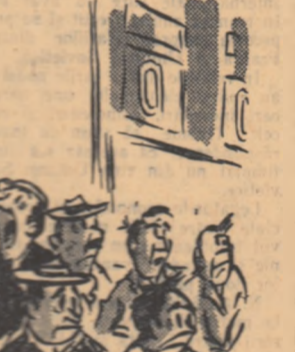
Desen de MATTY

— „Eu acum am penit... care sînt ai noștri, vă rog?...” — „Aie în galben-albastru, care poartăză murea mîngea...” la arbitru.