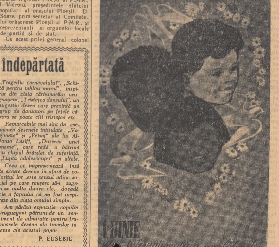
Am părăsit expoziția copiilor uruguayeni pătruns de un sentiment de admirație pentru frumoasele desene ale tinerilor talente ale acestui popor. P. EUSEBIU

Duminică dimineața a avut loc la Ploestii o înmînare solemnă a unei plăci comemorative cu ocazia împlinirii a 80 de ani de la înmînarea drapelului din Sa poporului bulgar față de poporul român. În fața locuitorii orașului Ploestii, care au sprijinit crearea primelor detașamente de voluntari bulgari nucleul viitoare armate naționale bulgare. La amiază, pe strada Iași din orașul Ploestii, în fața clădirii unde în 1877 era instalat comandamentul detașamentelor de voluntari bulgari, a avut loc solemnitatea dezvelirii plăcii comemorative. Deschizînd solemnitatea tov. I. Vidroiu, președintele sfatului popular al orașului Ploestii, a dezvelit placa comemorativă pe care erau înscrise în limbile romină, bulgară și rusă cuvintele: „În această casă era instalat sfat-