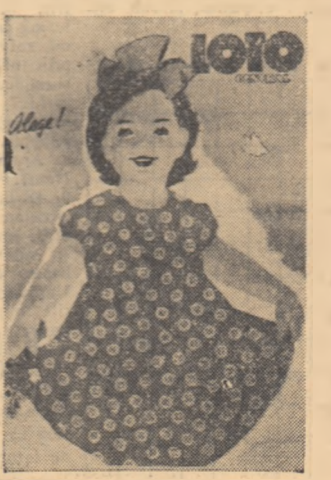
O reclamă izbucită pentru „Loto”