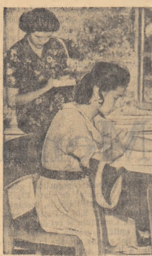
Cu o zi înainte de examen, într-un cămin de studenți