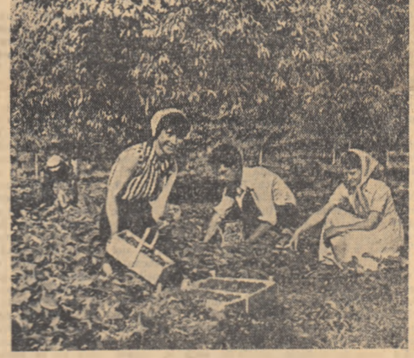
La G.A.S. Florești regiunea Galați se lucrează intens în aceste zile la culesul cîpsunilor de pe o suprafață de 4 ha. În fotografie: muncitorii din brigada pomologică a secției Petrești.