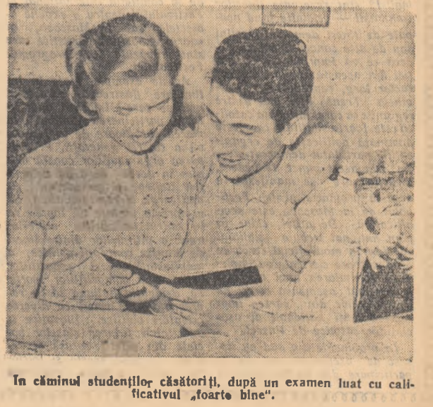
În căminul studenților căsătorii, după un examen luat cu calificativul „foarte bine”.