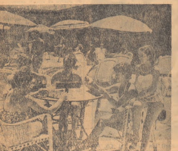
E zi de strand. Baza sportivă studențească de la lacul Tei nu duce lipsă de oaspeți. Am surprins doar câteva din ei: pe cei care s-au refugiat, după câteva ore de plajă, pe terasă, la o partidă de reini.