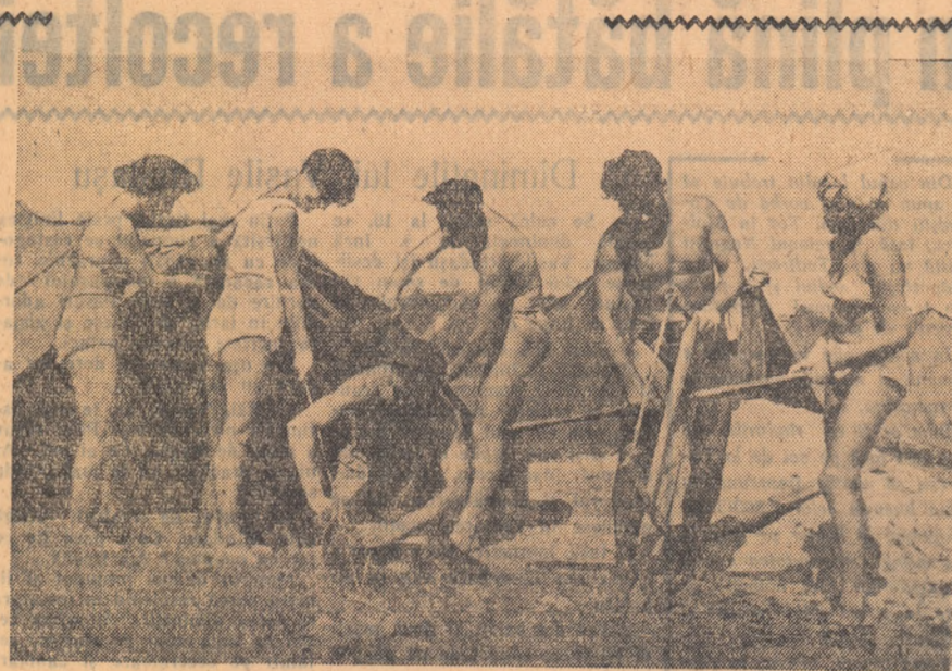
Satisfăcut de răspuns am părăsit grupul lăsându-i să lucreze. Pe plajă... „activitate“ de plajă: baie, baie de nisip, baie de soare, jocuri...