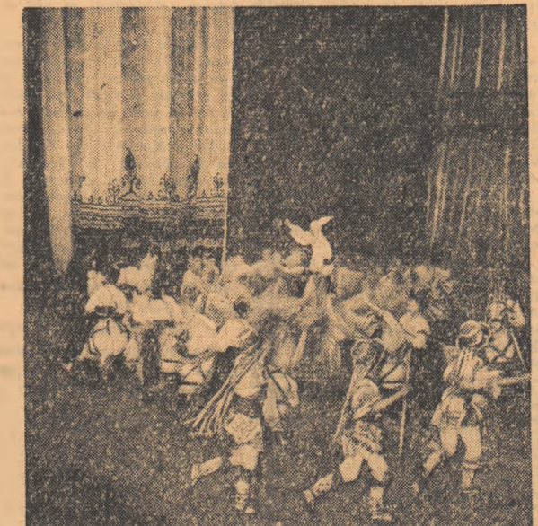
Pînă la Festival mai sint puține zile. Tinerii artiști romîni care ne vor reprezenta la Moscova se pregătesc de aceea cu înfrigurare pentru zilele marelui sărbători a tineretului