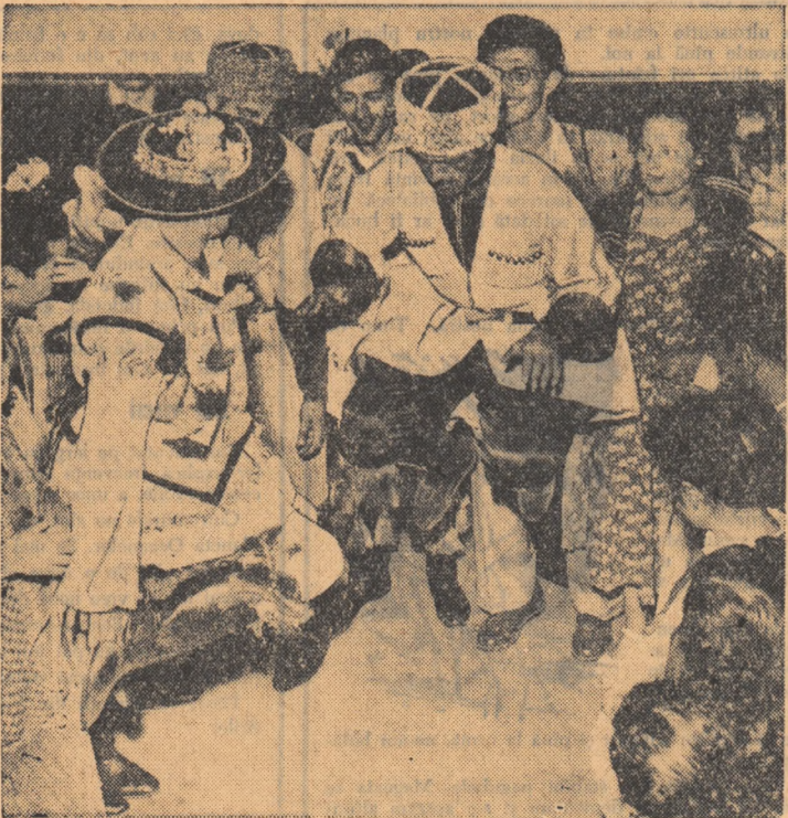
Și pe apucate se pot învăța noi figuri de dans — par a ne spune tinerii romîni și azerbaidjani din fotografie.