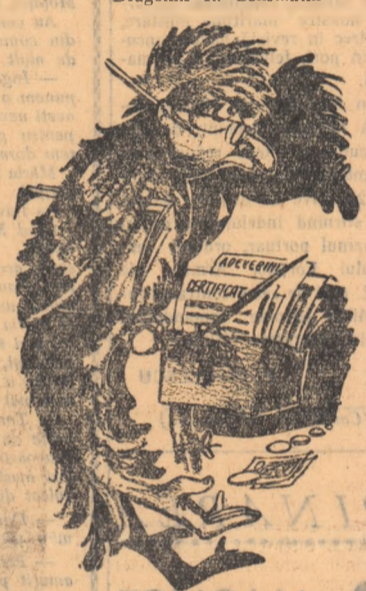
Desen de N. CLAUDIU