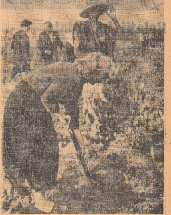
„Și lăstarul acesta, și celălalt și toți la un loc vor crește, vor înflori, rămîniind peste veacuri ca o mărturie vie a dorinței de pace și prietenie a tineretului lumii.

Bogatul program al celei de-a 8-a zi a Festivalului s-a încheiat cu întîlnirea unor oameni de literatură și artă cu un simpozion mondial cu tineretul din mai multe țări. La întîlnirea organizată în Sala Coloanelor a Casei Sindicatelor au venit mari scriitori și artiști din Brazilia, India, Italia, Anglia, Ceylon, Uniunea Sovietică și alți țări.