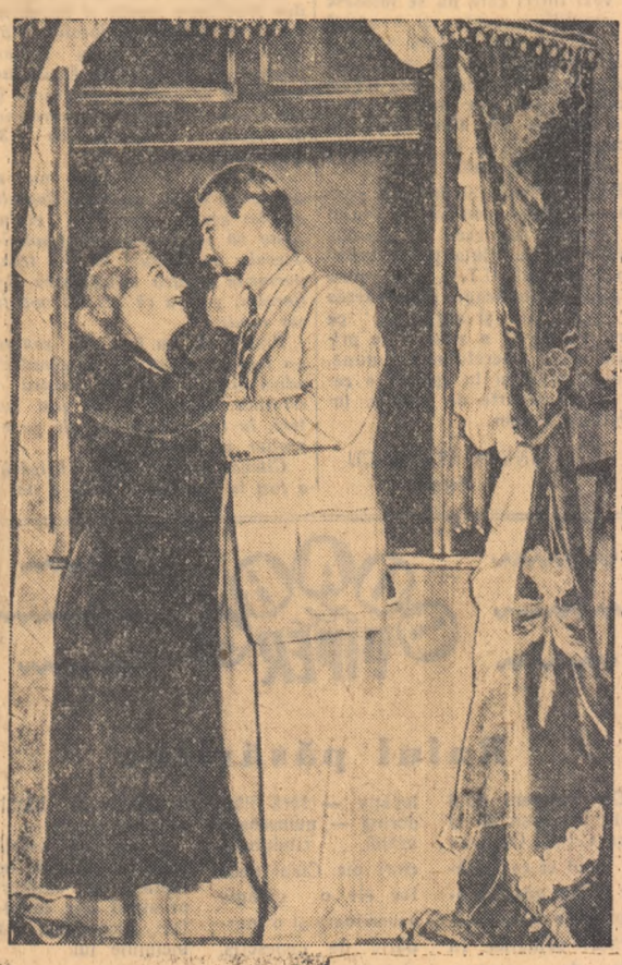
Duminică a avut loc în întreaga ţară deschiderea festivă a stagiilor teatrale 1957-1958. În emoţia slujitorilor teatrului ca şi a spectatoriilor erau cuprinse şi bucuria şi urările de bine pentru progresul teatrului nostru...