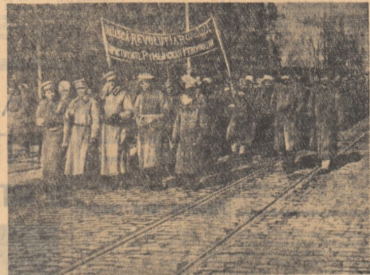
Batalionul revoluționar românesc pe străzile Odesei.

menșină orașul nu mai aveau hrană și muniții necesare. Se spunea atunci că numai divizia lui Ceapaev va putea să spargă încercuirea și să salveze orașul de cotropirea albilor. Ne-am imbarcat în trenuri și am plecat la Uralak. Prin-o lovitură fulgerătoare, am spart încercuirea, i-am pus pe fugă pe albi și am început să-i urmărim către Marea Caspică. Pe la începutul lunii septembrie 1919 ajunșem, fugînd pe cazacii albi, la localitatea Lbisensk pe malul rîului Ural. Văzînd că nu ne pot sta în cale, intr-o noapte, albi au strecurat în spatele nostru cîteva escadroane de cavalerie care au reușit să înconjoare „Stabul” nostru instalat în Lbisensk. Ceapaev, după ce a rezistat un timp trăgînd cu mitraliera în dușman,