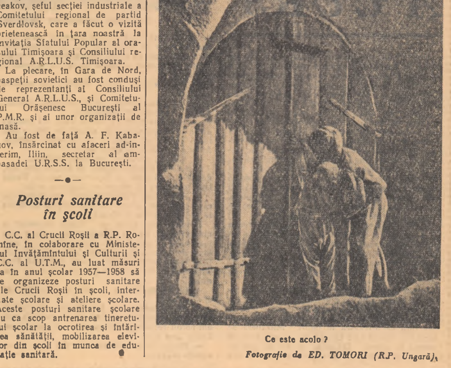
Ce este acolo?