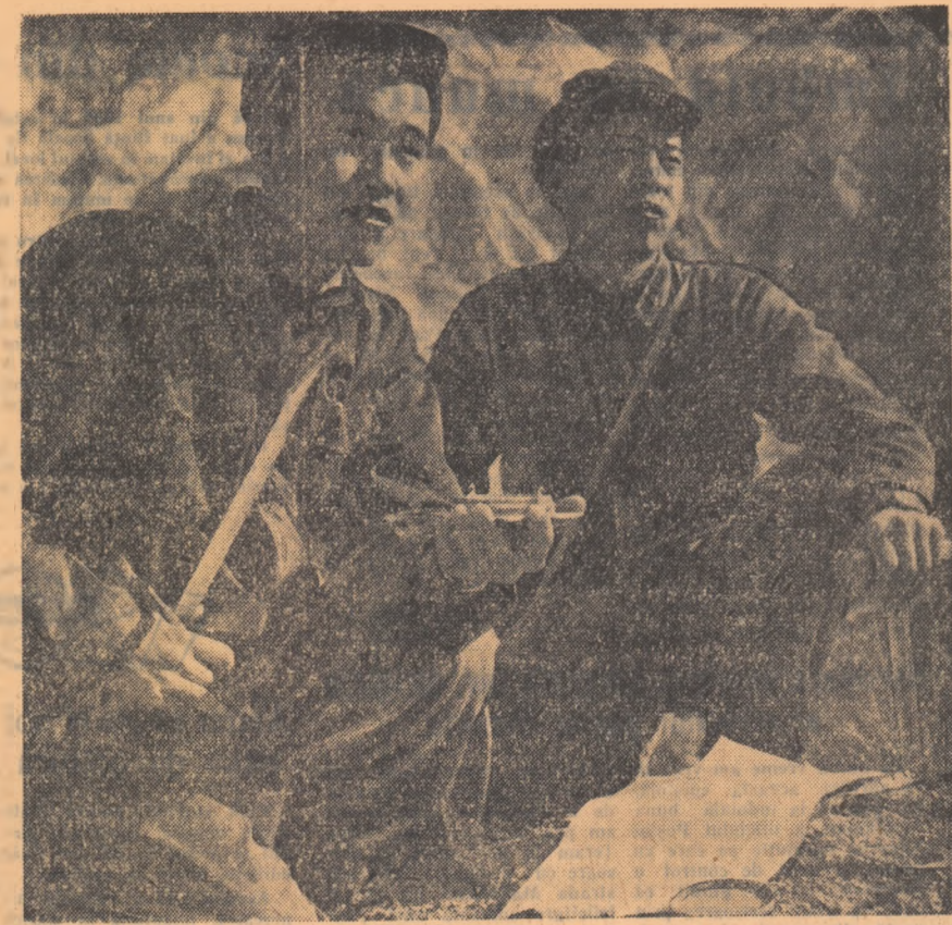
Urșișe sînt bogățiile subpămîntene ale Chinei populare. An de an crește numărul cadrelor de fineri geologi ce-și dăruiesc toate forțele luptei pentru continua înflorire a economiei naționale.

Prof. Louis de Broglie și prof. Jacques Hadamard au exprimat cu acea modestie care constituie caracteristica copleului profesoral al Universităților franceze, mulțumirile lor pentru cinstea ce le-a fost acordată, și au spus patru compatrioți ai lor, „Acest gest, a spus Louis de Broglie, este un drept la inimă. Noi toți cunoaștem vechea prietenie care leagă cele două popoare ale noastre și dorim cu toții ca aceste legături să continue și să se întărească”.