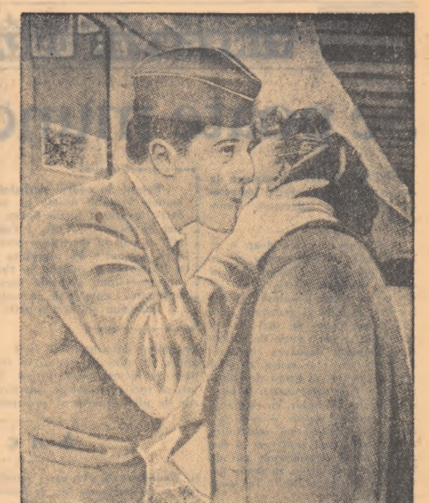
Tinutul care-l vedeți în fotografie este un tinăr francez care a refuzat să lupte împotriva poporului algerian. Pentru aceasta el a fost condamnat la ani grei de temniță. Iată-l în fotografia de mai sus luându-și rămas bun de la mama sa.

(Urmare din pag. 1-a) hitlerist au reușit să treacă oceanul salvator și să se culbrecă prin țările Americii Latine. Așa că nu e de mirare că se întimplă câte unii dictatori pasageri să fie zgâlțîiți de duhurile fasciste și ca în loc de pomana de moși pentru odihna sufletului răposatului să-l tragă elte o emisiune monetară cu elogia de tragică amintire a dictatorilor fasciști.