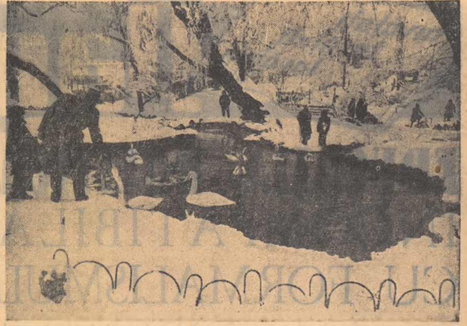
Zi de lărnă în Clujmigiu.

Citiți azi: Pagina elevului (pag 2-a) Pagina specială: Zona păcii (pag. 4-a)