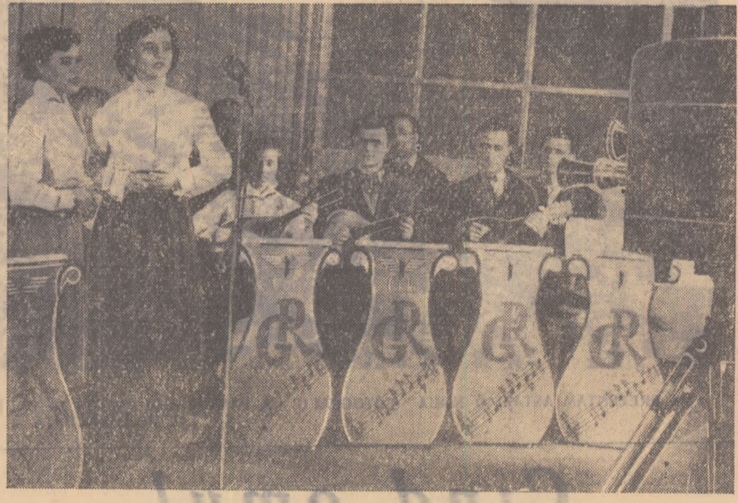
La clubul „Grivița Rosie” funcționează mai multe cercuri. Iată membri al cercului de muzică cîntînd în fața obiectivului televiziunii.

Anul XIV, Seria II-a Nr. 2727 4 PAGINI — 20 BANI Vineri 14 februarie 1958