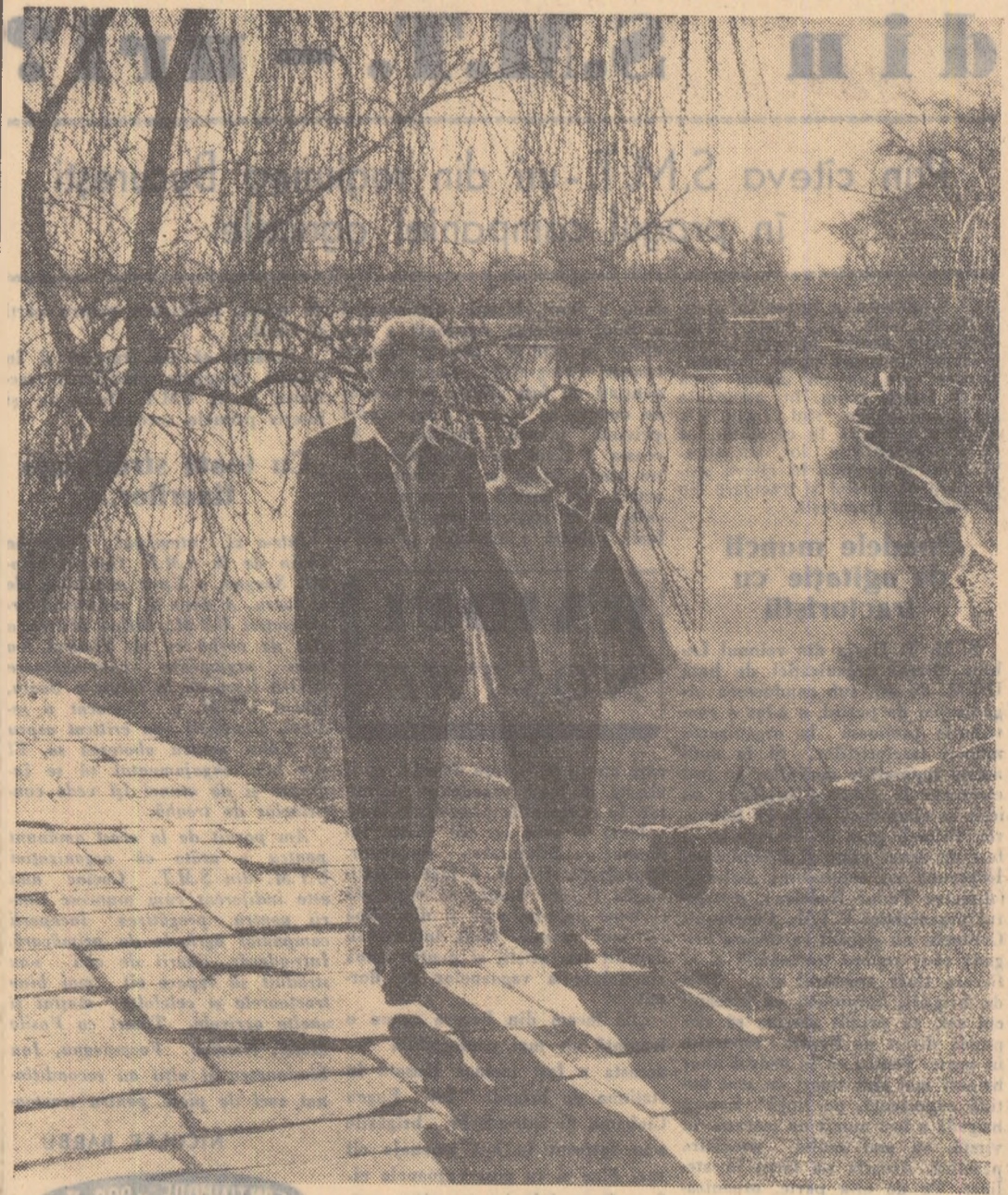
Primăvara în natură și în înimi

Sute de mii de țărânci lucrează azi în gospodăriile agricole colective. În cooperativele de producție și în întovășirile agricole. Ele văd că gospodăria a-