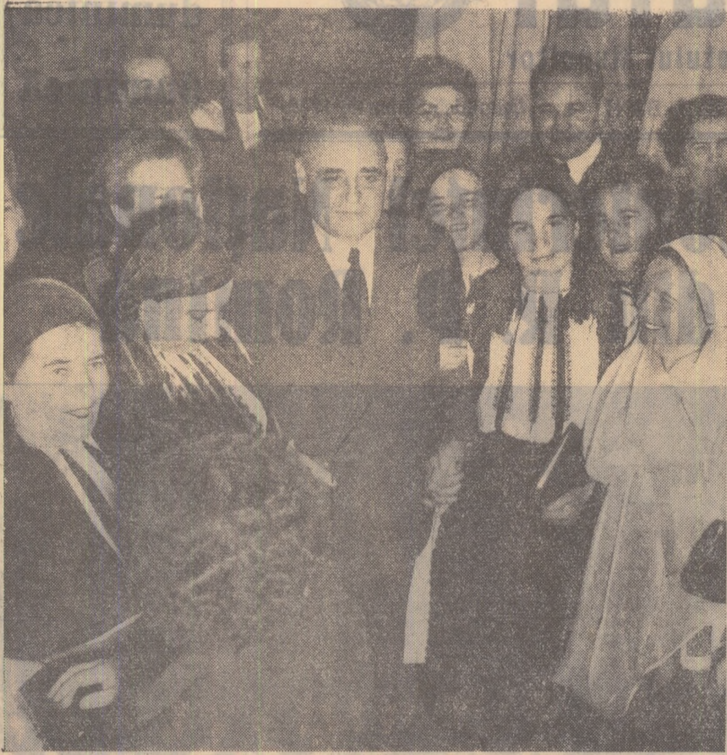
Tov. Gheorghe Gheorghiu-Dej împreună cu un grup de delegate