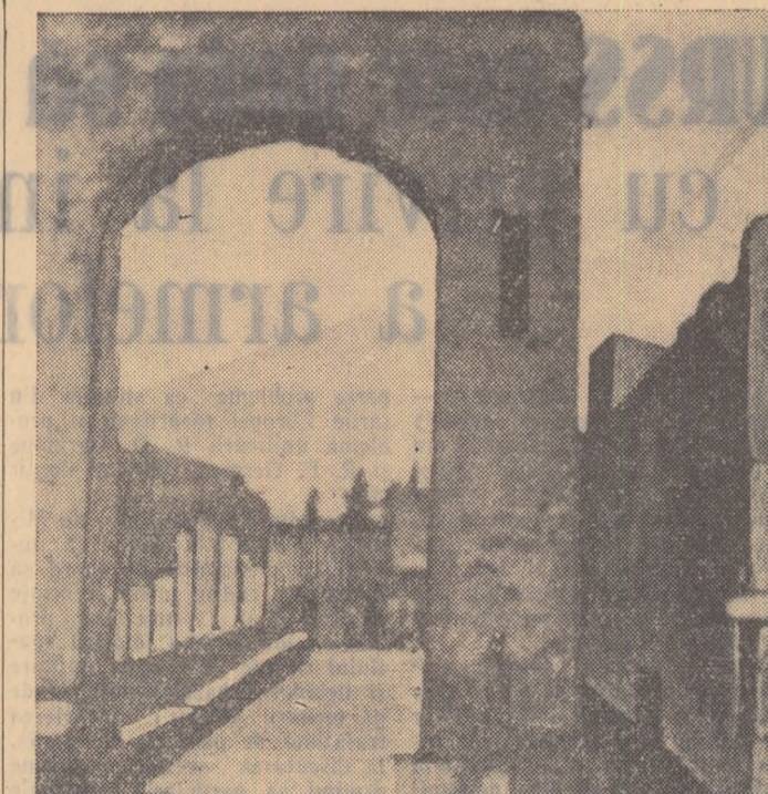
După 1800 de ani orașul Pompei pare că trăiește încă