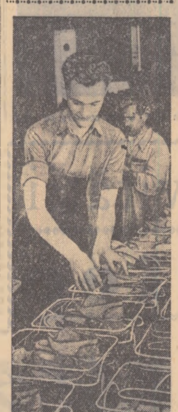
Intreprinderile pregătesc articole pentru sezonul de vară.

Entuziasma activitate desfășurată de tînărul din comuna Luclu este un exemplu care trebuie urmat de toți tînărul din comunele și satete patriei noastre. Colective de specialiști tineri și vîrstnici, studind posibilitățile existente pentru mărirea suprafețelor agricole, au constatat că în majoritatea raioanelor din regiunea Ploiești sînt mari rezerve de terenuri neproductive, care pot fi redade agriculturii. Pentru realizarea acestui important obiectiv s-au stabilit ca prime măsuri asigurarea terenurilor măștinoase și diguirea unor porțiuni din malurile rîurilor și bălților. Totalizînd-se suprafețele care pot fi recuperate, s-a constatat că într-un timp relativ scurt pot reîntra în circuitul producției peste 5.000 hectare teren. Vestea în comunele Vintileasca, Pietrosale, Clondru și Găgeni, secretaria raional Mîzil sînt nu mai puțin de 3.000 hectare teren care poate fi redat agriculturii, iar în comuna Refov și Băreanesti din raionul Ploiești alte 650 hectare. Asemenea rezerve există și în raioanele Buzău, Rm. Sîrat, Crivov, Pogoanele și altele. În această acțiune sînt necesare însă numeroase brațe de muncă, atelaje, unelte. Tînărul din regiunea Ploiești au răspuns întodeauna cu entuziasm la toate acțiunile de interes obștesc: insolzații, împăduriri, întreprinderi și refacerea viilor și livezilor. Și de data aceasta, la chemarea comitetului regional U.T.M. ei s-au angajat să ajute stăruitor popular (prin muncă voluntară) la realizarea acestui important