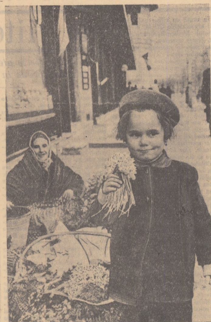
Ce surpriză va fi pentru mămica!

Imaginația noastră cu greu își poate închipi uriașele transformări pe care oamenii sînt capabili