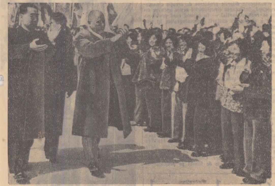
Tovarășii Chivu Stoica și Ciu En-lai aclamați de populație pe aeroport, la sosirea delegației romine

PEKIN 2 (De la tribuna specială Agerpres). — În dimineața zilei de 2 aprilie a sosit la Pekin delegația guvernamentală a R.P.R. Romine — tovarășii Chivu Stoica, președintele Consiliului de Miniștri, conducătorul delegației, Emil Bodnăraș, vicepreședintele al Consiliului de Miniștri, Avram Bucaci, ministrul Afacerilor Externe. Pe noul aeroport al capitalei Chineze, care a fost inaugurat în luna februarie a.c., sîrăluceau în lumina soarelui de primăvară nenumărate stelele multicolore, dominate de drapelul de stat al celor două țări prietene. Peste șapte mii de oameni veniți să întâmpine pe înalții oaspeți, formau un imens caracul în jurul podiului așezat în fața clădirii centrale a aeroportului. În întâmpinarea delegației guvernamentale romine au sosit