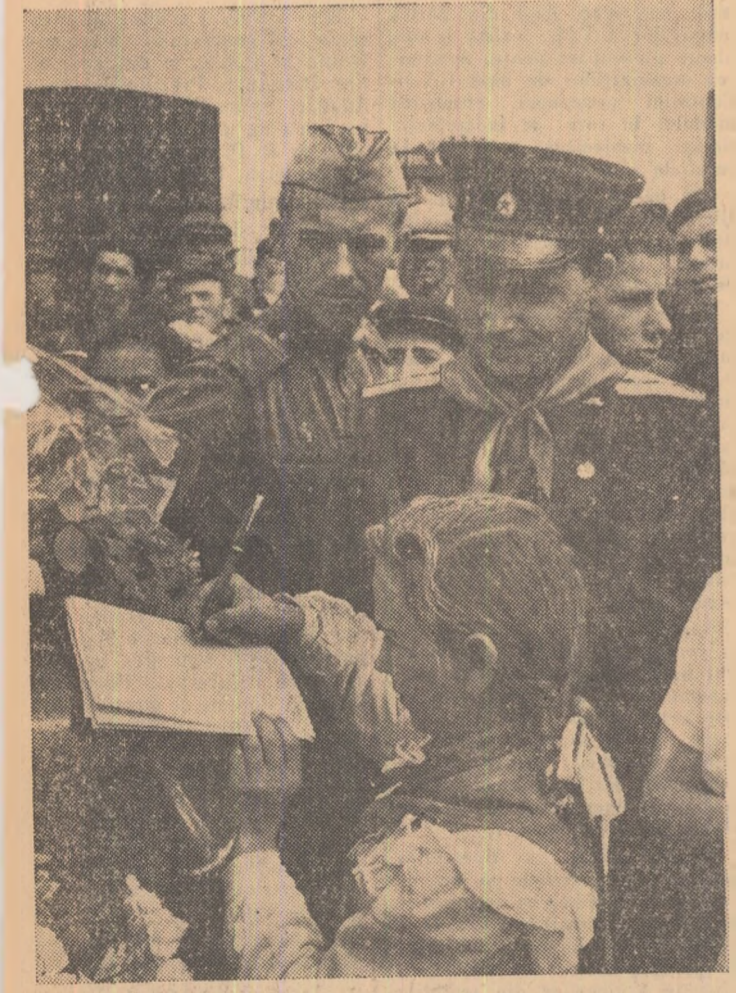
La Focșani, o pionieră scrie cite va rînduri prietenești, după ce a dăruit o cravată purpurie unui ofițer sovietic