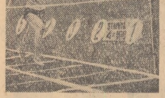
O desfășurare interesantă a oferit ștafeta feminină

M. ZONIS Orebro (20.000 de spectatori) Franța — Scoția 2-1 (2-0). Malmoe (40.000 spectatori) R. F. Germană — Irlanda de Nord 2-2 (1-1). Haelsingborg (30.000 spectatori) Cehoslovacia — Argentina 6-1 (3-0). Jată rezultatele de duminică: Boras (17.000 spectatori) Austria — Anglia 2-2 (1-0). Götteborg (53.000 spectatori) Brazilia — U.R.S.S. 2-0 (1-0). Sandviken (30.000 spectatori) R. P. Ungară — Mexic 4-0 (1-0). Stockholm (30.000 spectatori) Suedia — Tara Galilor 0-0. Eskilstuna (25.000 spectatori) Iugoslavia — Paraguay 3-3 (2-1).