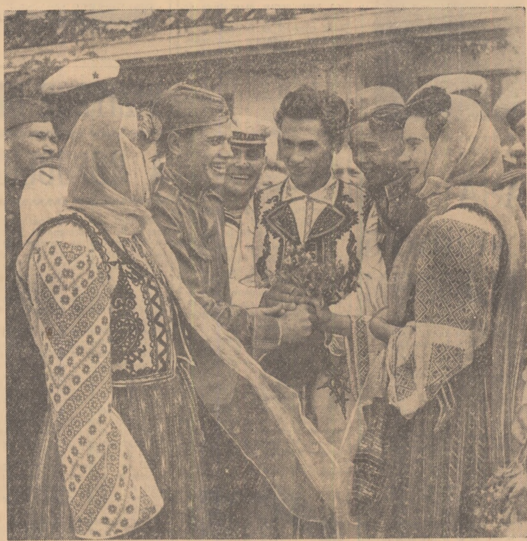
Se string prietenește minii tinere, se dăruiesc flori

Pe stadionul „Portul Roșu”, în așteptarea începerii mitingului de rămas bun, mii de oameni ai muncii așteptau pe gazonul stadionului și în tribune scandează lozinci slăvind prietenia romino-sovietică. Tribuna este pavată cu steaguri rominești și sovietice, cu portretele tovarășilor N. S. Hrușciov, Gh. Gheorghiu-Dej și Chivu Stoica.