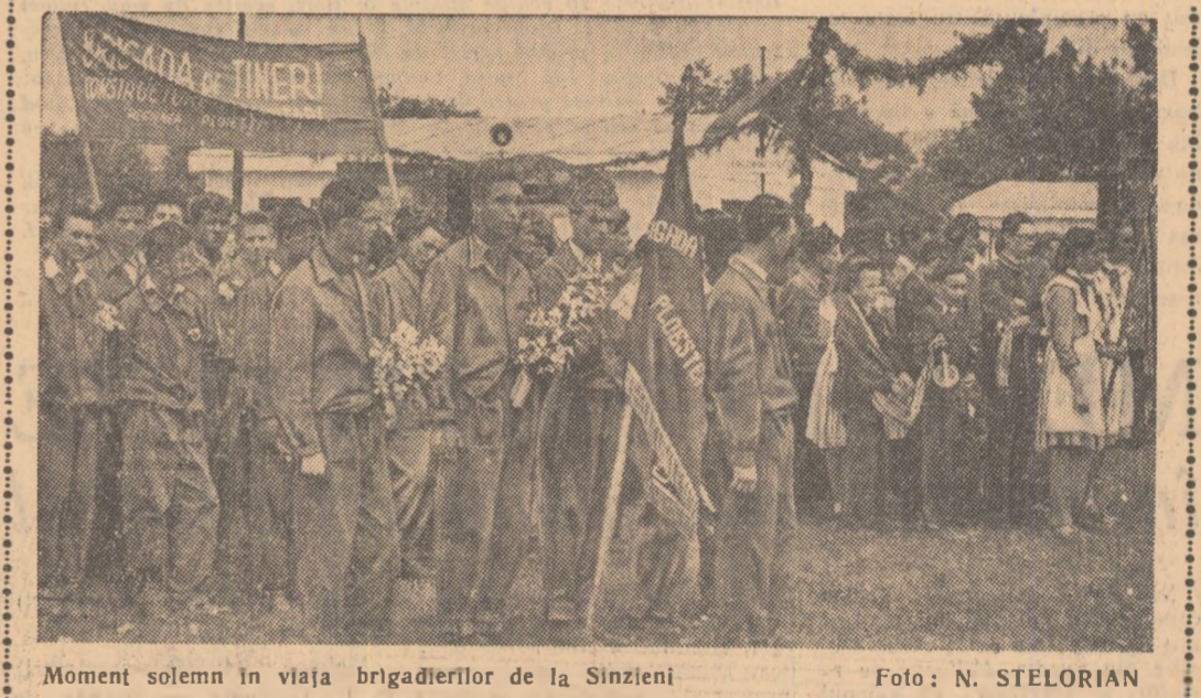
Moment solemn în viața brigadierilor de la Sinzieni

deplin planul priorităților industriale din țara noastră, în primul semestru al acestui an. În primele cinci luni ale anului la această uzină productivitatea muncii a sporit față de plan cu 9,5 la sută, iar prin reducerea prețului de cost au fost realizate economii de 4.300.000 de lei. Cu 20 de zile înainte de termen au in-