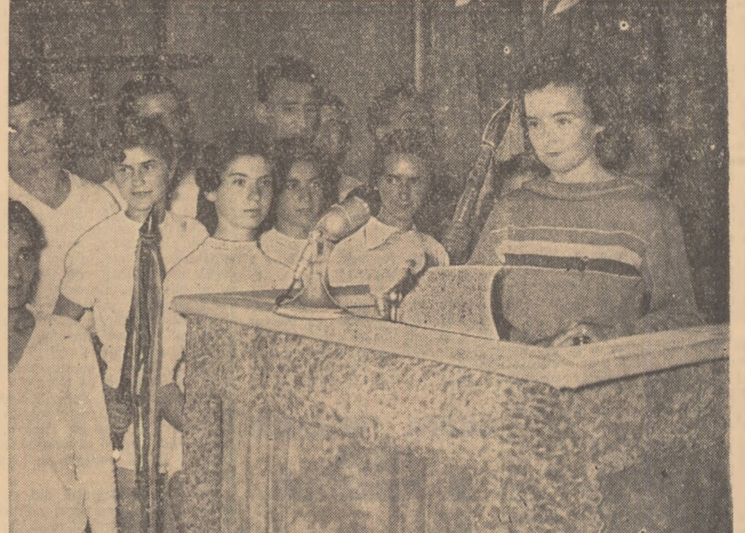
După ce a străbătut pămîntul patriei, „Ștafeta Păcii” a adus Conferinței salutul tineretului și sportivilor