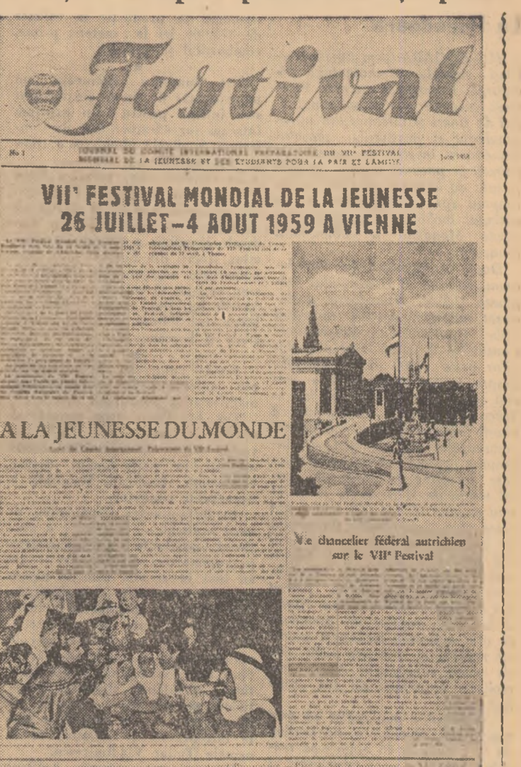
Prima pagină a ziarului „Festival”

Ca aripile albe ale primilor pescăruși, care anunță viitorul port, tot astfel paginile albe ale ziarului internațional „Festival” ne-a obișnuit să ne prevestească marile întîlniri ale tineretului lumii. Mai sînt 13 luni pînă ce, la 26 iulie 1959, drapelul Festivalului va fi ridicat și primul număr al ziarului său este deja în mîinile noastre.