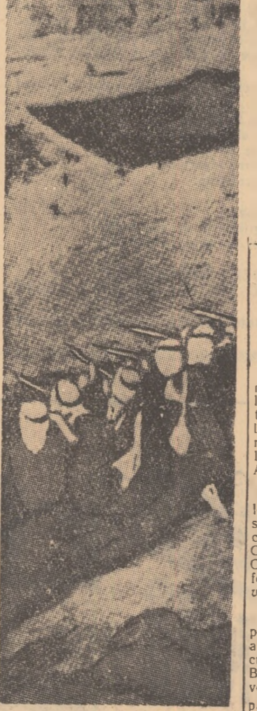
Triburi răscolite luptînd în munți

BEIRUT 23 (Agerpres). — Principalele centre unde s-au desfășurat luptele între forțele populare și trupele guvernamentale libaneze în ultimele 24 de ore au fost Beirut și orașul Tripoli. Agenția France Presse relatează că dimineață după masă a avut loc un viu schimb de focuri în sectorul rafinării Companiei „Irak-Petroleum” din Tripoli. Luptele, au continuat în tot cursul nopții, armata făcînd uz de artilerie împotriva răsculaților. A fost pus în aplicare ordinul Ministerului Apărării al Libanului de a se destruge toate casele de unde pornește focul deschis de răsculați sau se bănuiește că s-ar afla membri ai forțelor populare.