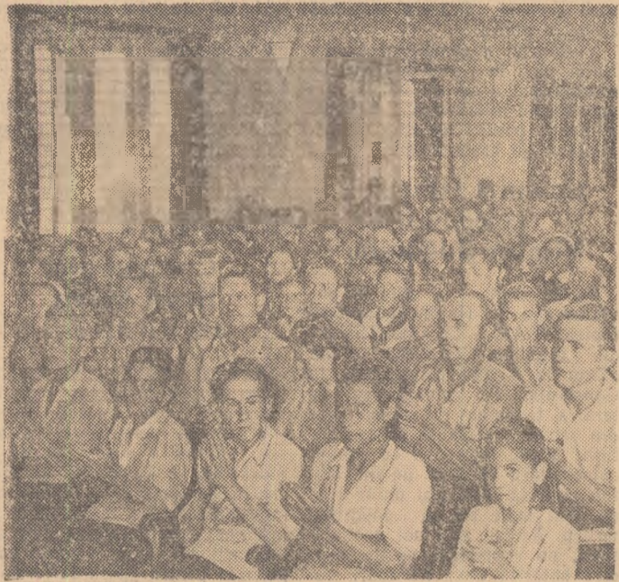
„Steaua Roșie” care permanent își depășește planul.

Dar în lumea capitalistă tineretul muncitor este nevoit să lupte din greu pentru o bucată de pâine amară. Știați că în Japonia tinerii muncitori au deabia 25 la sută din salariul de hrană mieșter al muncitorilor „străini” de arenele californice cu ei? Știați că printre cei 6 milioane de șomeri americani, mulți, foarte mulți sînt tineri?