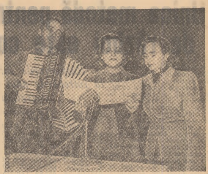
Brigada artistică a fabricii de vopsele și lacuri „Transilvania” din Oradea prezintă un program la stația de radiodifuziune.