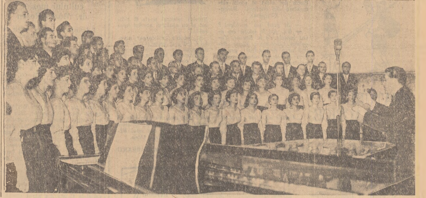
Capela corală „Gh. Cucu”

Delegația a fost condusă de deputatul Gerald Götting, vicepreședinte al Camerei Populare, secretar general al Uniunii Creștin-Democrate din Germania.