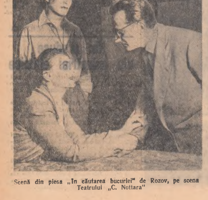
Scenă din piesa „In căutarea bucuriei” de Rozov, pe scena Teatrului „C. Nottara”

Preajacerea mentalității țăraniilor săraci se produce în focul bătăliilor politice, pe care romanicivul le pictează cu o artă perfectă, formată la școala marilor prozatori romîni, ca și a unor maestri de peste hotare ai romanului realist socialist. Cine citește romanul nu va uita niciodată unele episoade. Nu uita bunăoară episodul în care țărani din Lunca și din alte sate pornesc ațîțați de elemente reacționare, împotriva țăraniilor maghiari, pentru ca în momentul cînd activității le vestește împărțirea pămîntului moșieresc, să se îndrepte, ca un singur om, în frunte cu reprezentanții partidului spre sediul preturii, pentru a gonii pe pretorul reacționar ce împiedicase realizarea reformei agrare în plasa respecti-