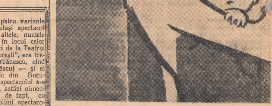
Afișul „Nu!” de I. Lessen

Și totuși, pe-această cutie care vrăjește și place și-mbie pictorul ceva a uitat: a uitat un braț înelat care păzește cu cravașa de piele de porc pe acel ce sudorează și-o storp, pe acel ce țin Africa-n mîini dar fără să-i fie stăpîni.