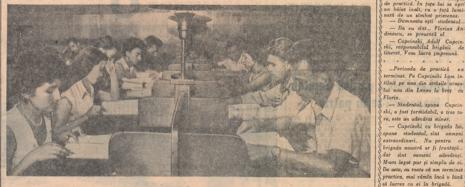
Fotoreporterul nostru a prins pe peliculă un grup de studenți ai Universității „C. I. Parhon” ce se pregătesc asiduu, în frumoasa bibliotecă a Facultății de Științe Juridice, pentru apropiata bătălie a examenelor din sesiunea de toamnă.