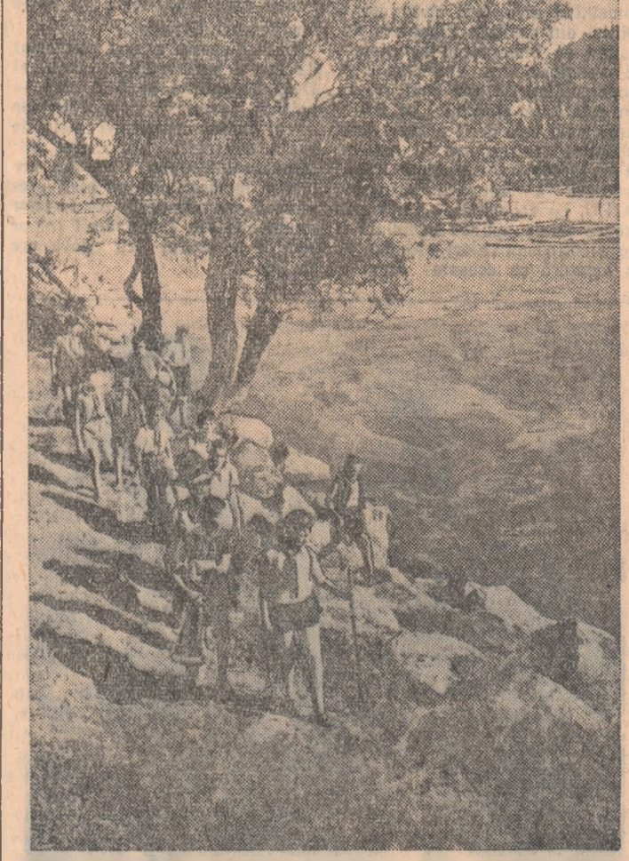
Statul democrat-popular acordă o grijă deosebită creșterii tinerii generații. Au de a-și organizat tabere de vară unde copiii oamenilor muncii petrec o vacanță plină de bucurii. În fotografie: un moment dintr-una din excursiile unei tabere a pionierilor și școlărilor din Bacău.

Statul democrat-popular acordă o grijă deosebită creșterii tinerii generații. Au de a-și organizat tabere de vară unde copiii oamenilor muncii petrec o vacanță plină de bucurii.