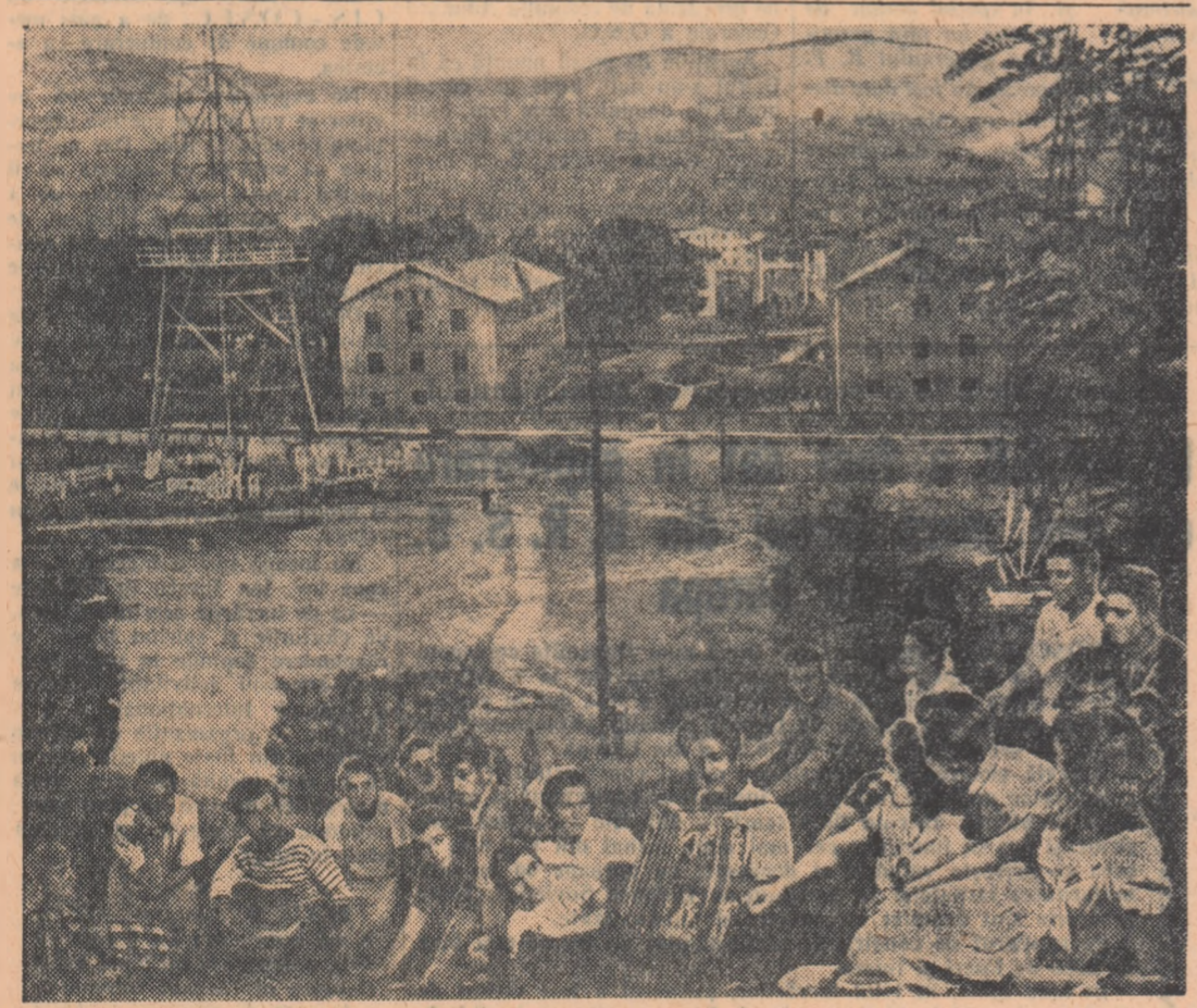
Un grup de tineri petrolisti de la schela petroliferă Moinești, distrîndu-se în timpul liber în împrejurimile noului oraș Lucăcești.

Pregătiți toate condițiile necesare pentru executarea însămîntărilor în timpul optim, punînd astfel o temelie solidă recoltei or anului viitor!