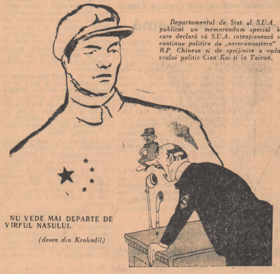
NU VEDE MAI DEPARTE DE VIRFUL NASULUI. (desen din Krokodil)

conducerea partidului comunist a crescut mult ritmul de construcție a socialismului în China. Avînd în vedere presiunea crescîndă a vederea industriei din partea producției agricole care se dezvoltă în salturi, a subliniat președintele Mao Tze-dun, precum și faptul că în domeniul producției agricole și al muncii la sate există în prezent o bază relativ solidă și o experiență relativ mare, centrul de greutate al muncii de conducere trebuie mutat la timp din agricultură și munca la sate spre construcția industrială. Organele de conducere centrale și provinciale trebuie să ia într-o mină în prezent o bază relativ solidă și o experiență relativ mare, centrul de greutate al muncii de conducere trebuie mutat la timp din agricultură și munca la sate spre construcția industrială. Organele de conducere centrale și provinciale trebuie să ia într-o mină în prezent o bază relativ solidă și o experiență relativ mare, centrul de greutate al muncii de conducere trebuie mutat la timp din agricultură și munca la sate spre construcția industrială.