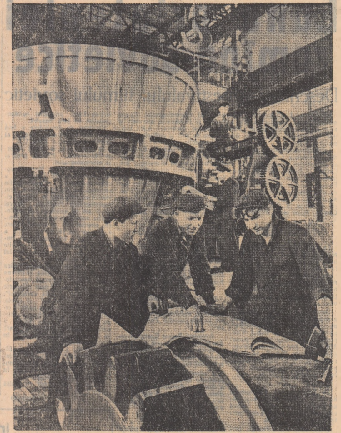
La uzina de construcții de mașini grele din Sverdlovsk lucrează mulți tineri. În fotografie: secția de fabricare a escavatoarelor pâltoare. Aici lucrează o brigadă de tineri comsomolști rașionaliști care a realizat într-un timp scurt economii în valoare de 808 milioane ruble.