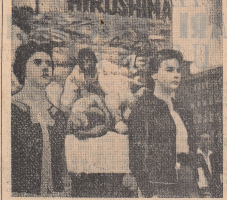
Una din importante acțiuni împotriva pericolului nuclear este garda antiatomică la care luă parte numeroase personalități din diferite domenii de activitate. În fotografie: O gardă antiatomică în orașul vest-german Essen.

(Urmare din pag. 1-a) Igitent, care-și înțelege soțul șomer, trebuie să ia măsurile corespunzătoare. Primul simptom al neliniștii soțului trebuie să servească drept semnal pentru soția. În asemenea simptome pot fi faptul că pentru prima oară el lese la dejun neabîrțier, sau faptul că crava este murdară și cămășa șlonară. Remarcați, că rog, stîlul alambicat, sîrleacă de dragădimeni. Soțul șomer, aruncat cu brutalitate afară de la fabrică, măcinat în fiecare oră de dramatica întrebare „ce să dea de mâncare?” nu e zburcînd, sîrleacă de tragismul vieții sale, ci, neliniștit. Neliniștia așa cum ar fi, de pildă, din pricina zburcîndului de Jim care umbliind hă-hul cu alii șirengari, a înțrîțat seara. Nu e îndurerat șomerul, e doar neliniștit. Fineața stîlului e evidentă în toate frazele citate. Vedeți dumnezeoasă, șomerul umbli neabîrțier, cu cămășa șlonară, pînă la urmă murdară, din motive psihologice, nu pentru că i-ar lipsi pînă la centii pentru lama de ras, ci din pricina stării de spirit. Șomerul nu merge neabîrțier pentru că între rasul bărbii și pînă, prețea pe cea din urmă. Nu, el nu umbli murdar și jerpelit pentru că și-a vîndut hainele, ci numai așa, din motive psihologice. Iar dacă el persistă multă vreme în această stare, oia nu o poartă oriunde este obligată să vegheze ca soțul șomer să fie ocupat cu cîte ceva”. Vedeți dumnezeoasă că nu capitaliștii trebuie să