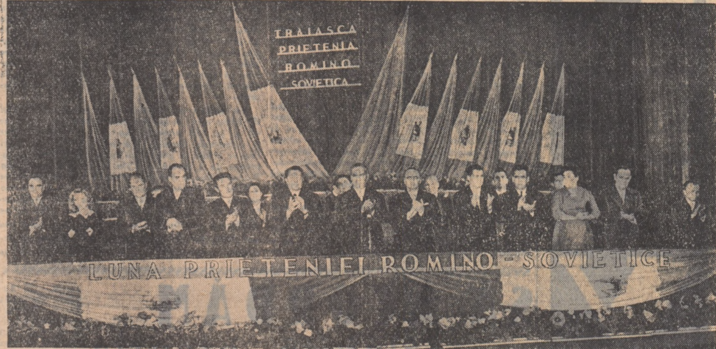
Prezidiul adunării festive