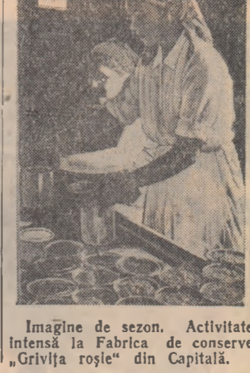
Imagine de sezon. Activitate intensă la Fabrica de conserve „Grivița roșie” din Capitală.

Profesorii — la locul de muncă Sînt de asemenea în școlile arătate profesori dintre cei mai buni, optima de însilozare și la transportul cantităților venite de în câmp la gropile de siloz. Alți 30 de tineri au fost repartizați în mașina de tocat și la așezarea porumbului în gropi.