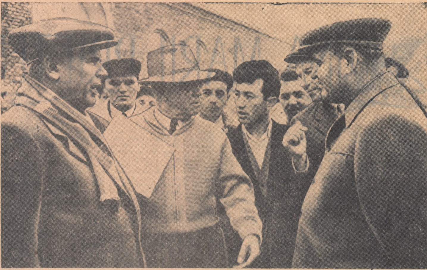
Tovarășii Gh. Gheorghiu-Dej, Chivu Stoica și Emil Bodnăraș în mijlocul muncitorilor și cadrelor de conducere de la centrala electrică de termoficare Borzești