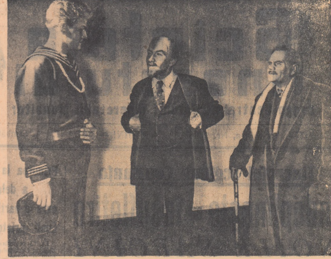
Zilele acestea se desfășoară în Capitală Festivalul teatrelor dramatice din R. P. Română. Multe teatre prezintă spectacole cu piese din minunata dramaturgie sovietică. Fotografia noastră reprezintă o scenă din spectacolul Teatrului de Stat din Bacău cu piesa „Orogiul Kremlinului” de N. Pogodin.