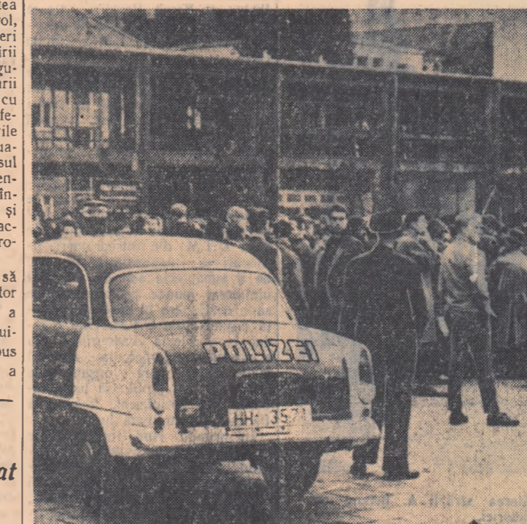
La 12 octombrie au avut loc la Hamburg-Eimsbüttel (R.F.G.) exerciții de apărare împotriva unui atac atomic...