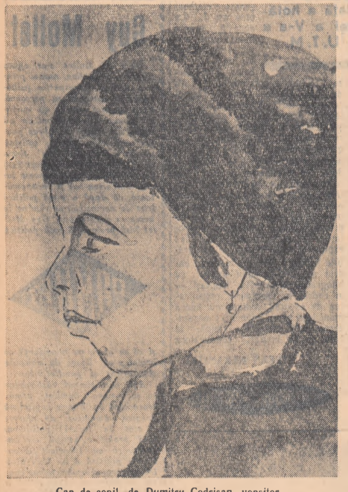
Cap de copil, de Dumitru Codrișan, vopsitor