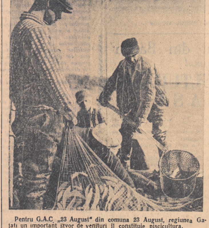
Pentru G.A.C. „23 August” din comuna 23 August, regiunea Galați un important izvor de venituri îl constituie piscicultura. În fotografie: echipa de pescari colectiviști în plină activitate.

Cititi în pag. 2-a DIN VIAȚA CULTURALĂ A TINERETULUI