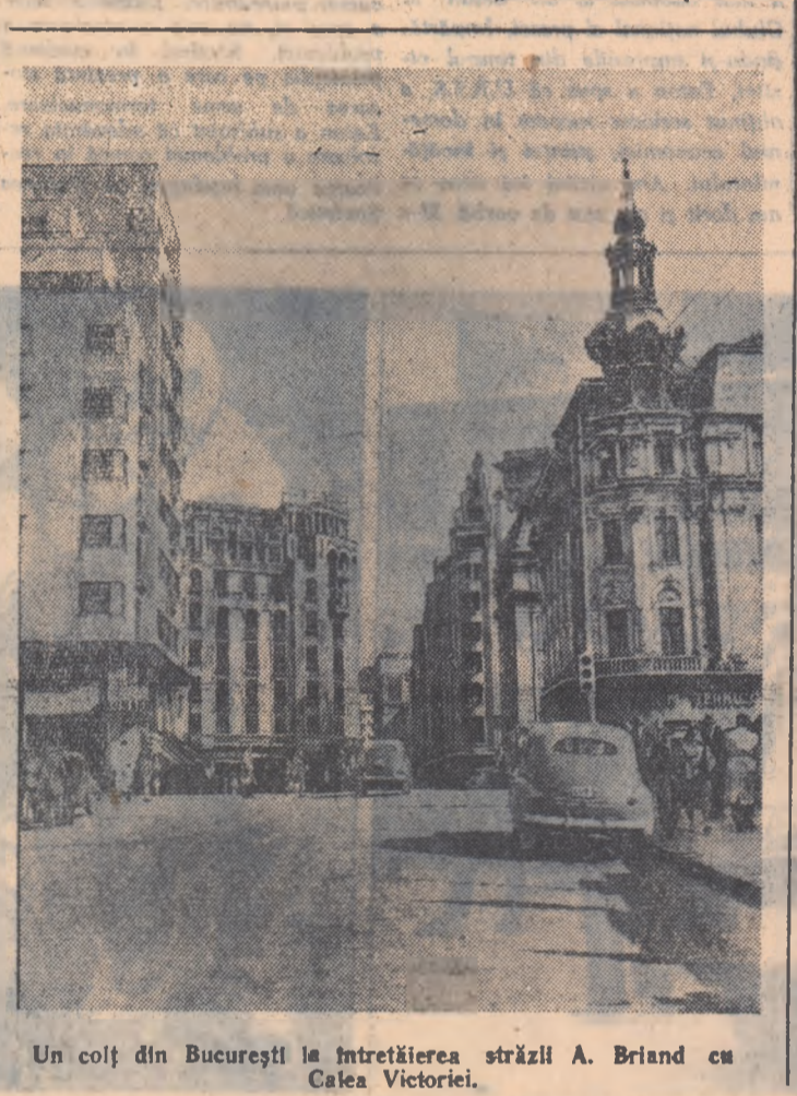
Un colț din București la întretîierea străzii A. Briand cu Calea Victoriei.

Duminică pe stadionul „23 August” din Capitală echipa reprezentativă de fotbal a R.P. Romîne debutează în competiția internațională „Cupa Europei inter-țări” întîlnind formația Turciei. Aceasta este cel de-al cincilea meci dintre selecționatele fotbalistilor romîni și turci. Pînă în prezent bilanțul întîlnirilor este favorabil echipei romîne, care din cele 4 jocuri a cîștigat două, unul s-a terminat la egalitate, iar un meci a fost cîștigat de echipa turcă. Ultima oară cele două reprezentative s-au întîlnit acum 30 de ani la Arad, cînd echipa noastră a cîștigat cu scorul de 4-2. În palmaresul echipei turce figurează o victorie cu 3-1 asupra R.P. Ungare, o victorie cu 2-1 asupra Olandei — obținută în deplasare — și jocuri egale cu Brazilia (0-0), Spania (2-2) și Belgia (1-1). În deschidere, cu începere de la ora 13, se va disputa meciul de rugby dintre echipele Locomotiva Grivița Rosie și C.C.A. Întîlnirea de fotbal R. P. Romîna — Turcia va fi transmisă în întregime de stațiile noastre de radio pe programul I. De asemenea jocul va fi redat la televiziune.