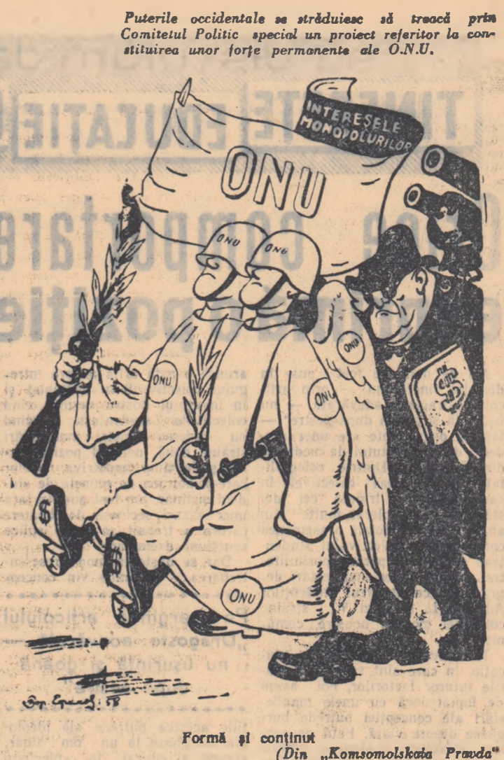
Formă și conținut