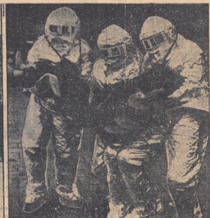
În prima fotografie: Un aspect al demonstrației. Publicul protestând împotriva exercițiilor de a înarmării atomice a R.F.G. Germane...