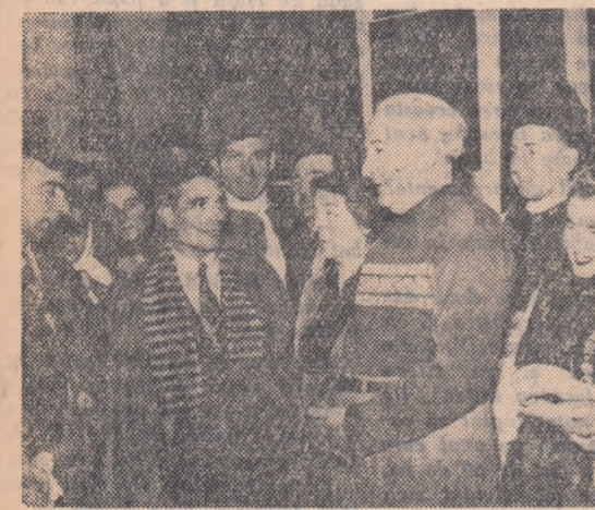
Artistul poporului Costache Antoniu în mijlocul unui grup de artiști amatori din regiunea Pitești

„...La două generații, față-n față: noi, cei care ne trăim abia acum tinerețea și ne realizăm cu adevărat visurile și tinerii care învăță pe băncile Institutului de teatru, care și trăiesc tinerețea la vremea ei, la vîrsta ei. Într-un fel învățăm în același timp: studenții și profesorii. Noi învățăm, știind că-am pierdut în anii cînd ar fi trebuit să învățăm cu adevărat. Studenții noștri învăță fiindcă așa este firesc astăzi; fiindcă au toate condițiile. Prin grija partidului le-au fost create cele mai bune condiții de învățură și de trai. Au un institut cu săli de curs, cu săli de repetiții, cu bibliotecă și săli de lectură, cu cămine și cantine, 80 la sută din ei au burse; și nu au o scenă improvizată ci un adevărat studiu cu o sală de spectacole. Dar toate acestea incumbă și obligații. Studenții au datoria de a învăța cu pasiune și dăruire, de a lupta să devină actori de valoare, cu o înaltă cultură, cu un înalt profil moral, actori care să dea viața pe scenă idealurilor înaintate, să intruchipeze oamenii înaintați ai epocii noastre, să slujească teatrul nou al poporului și operi de construire a socialismului.