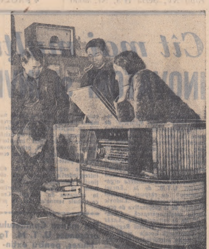
Uzina de aparate de telecomunicații, din Nankin, R. P. Chineză a construit un aparat de radio excepțional, cu 12 lămpi, ce poate recepționa toate posturile de radio din lume și care e înzestrat și cu pick-up.

In fotografie: verificarea aparatului.