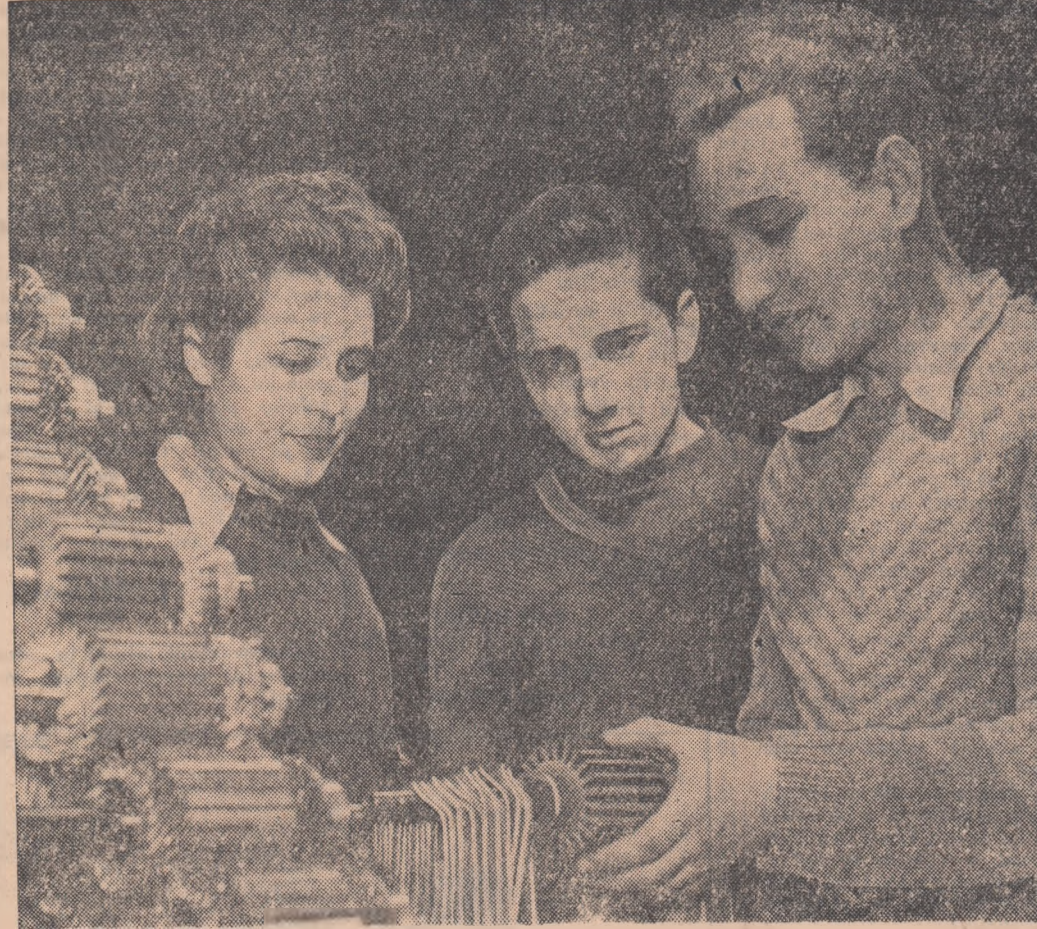
Fabrica „Clement Gottwald” din București. Aici, la secția bobinaj lucrează brigada de tineret...