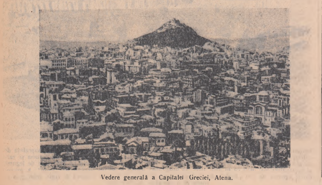
Vedere generală a Capitalei Greciei, Atena.

De data aceasta, transpunerea în viață a acestei inițiative se desfășoară în mod diferit ca de obicei. Intrecerea pe baza inițiativei respective presupune o discuție mai amplă în cadrul brigăzilor, decât întrecerile de până acum. Discuțiile se desfășoară în apărarea exigențelor sint mai sporite. Scurt timp după lansarea acestor chemări, trei brigăzi de tineret dintr-o uzină chimică s-au antrenat în această întrecere. În modurile lor „de a lucra în mod socialist” ei și-au luat între altele obligația: pentru a acorda un ajutor agriculturii socialiste să execute gratuit toate reparațiile de mașini în cooperativa agricolă de producție pe care o patronază în timpul lor liber și să prescrie zile de muncă voluntară la stringerea recoltei.