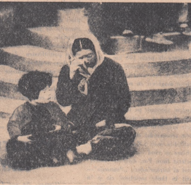
Populația din Coreea de Sud trăiește într-o neagră mizerie. Ca urmare a poliției lui Li Sin-man, în țară există 4.200.000 de someri. În fotografia noastră, una din cele 300.000 de văduve din Coreea de sud, cerșind în fața unei bănci din Seul.

NEW YORK 24 (Agerpres). — În cursul săptămânii trecute, ziarul New York Times a organizat o anchetă în rîndul opiniei publice americane pentru a stabili prin sondaj care este în general părerea cetățenilor din S.U.A. în principalele probleme ale situației internaționale.