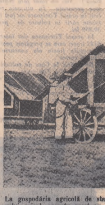
La gospodăria agricolă de stat Aradul Nou, din regiunea Timișoara, se dă o mare atenție sectorului avicol, care în acest an va crește cu încă 11.000 găini ouătoare. În fotografia noastră vă prezentăm un aspect de la dezinsecția cotețelor mobile pentru creșterea păsărilor în timp.

Astfel, cu sprijinul tineretului, conducerea gospodăriei a extins culturile irigate în acest an pe o suprafață de 130 de hectare cu porumb, 100 hectare cu grâu și 30 hectare cu sfeclă de zahăr. La propunerea organizației de bază U.T.M., organizația de partid și conducerea gospodăriei au încredințat aceste lucrări tineretului.