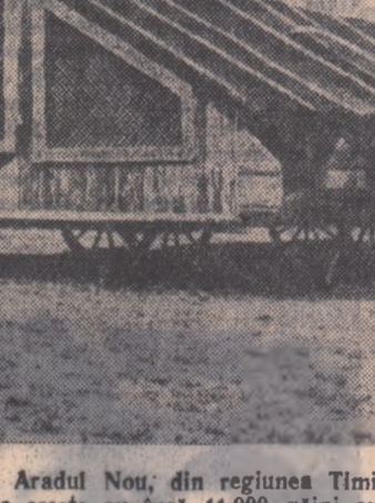
La gospodăria agricolă de stat Aradul Nou, din regiunea Timișoara, se dă o mare atenție sectorului avicol, care în acest an va crește cu încă 11.000 găini ouătoare. În fotografia noastră vă prezentăm un aspect de la dezinsecția cotețelor mobile pentru creșterea păsărilor în timp.

Preocupîndu-se neîncetat de educarea politică a tineretului și ridicarea activității lui în toate sectoarele de producție, stimulînd inițiativa bună ale tineretului în fiecare sector de muncă, organizația de bază U.T.M. își alege astfel o importantă contribuție la creșterea rentabilității gospodăriei de stat, la îndeplinirea sarcinilor trasate de partid și guvern acestor unități agricole socialiste.