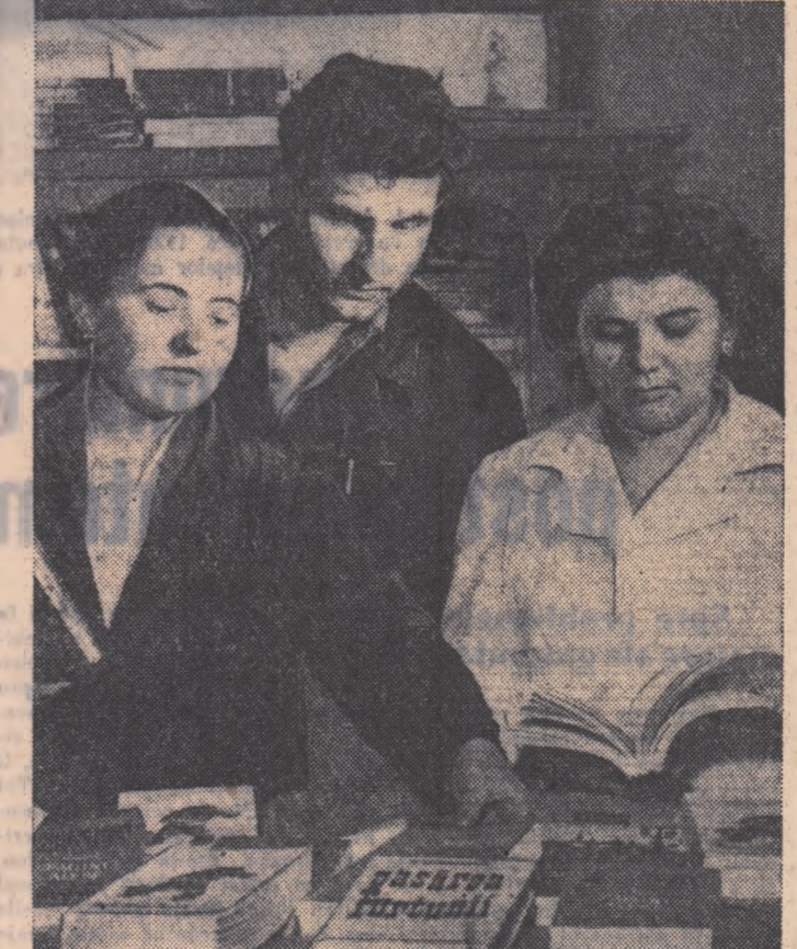
La standul de cărți al Atelierei centrale I.T.B. au sosit cărți noi.