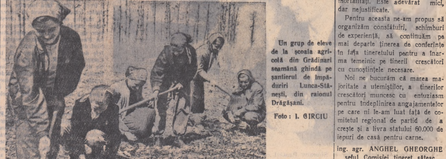
Un grup de eleve de la școala agricolă din Grădinarul șantierul de împăduriri Lunca-Stănești, din raionul Drăgășani.