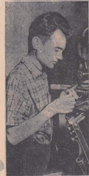
La întreprinderea „Electrofar” din Capitală se produc în serie lămpi infraroșii, becuri mitralai de 500 v. becuri oglindate, lămpi de heliograf, întrerupătoare cu mercur, încălzitoare de tensiune etc.