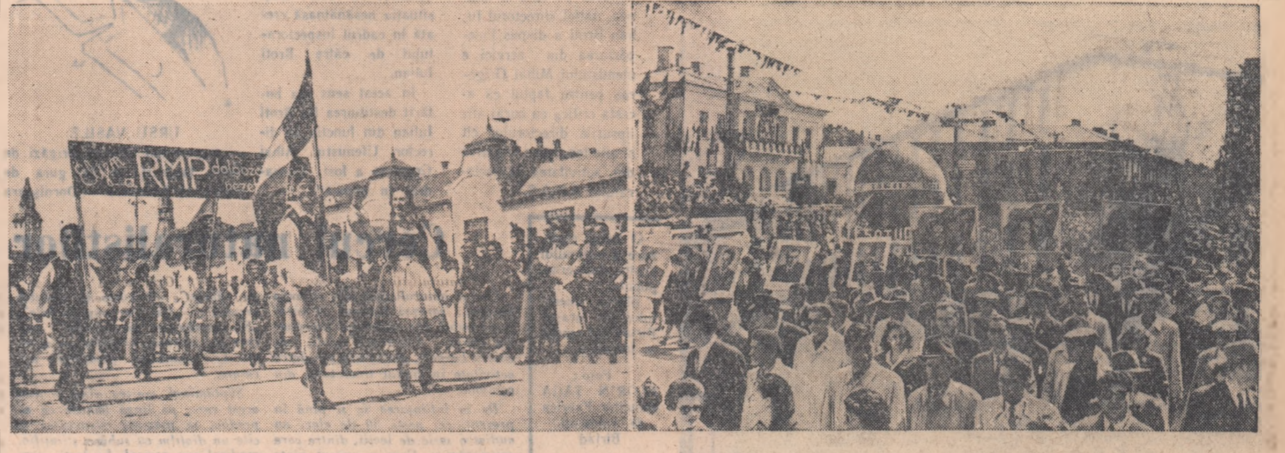
Demonstrația oamenilor muncii din Tg. Mureș.