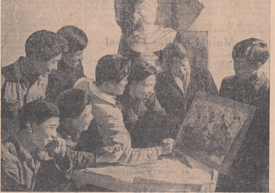
Uzina de molaare de automobile nr. 1 din Gianciun — R.P. Chineză. După orele de muncă tinerii se dedică creației.

Luînd cuvîntul, scriitorul american F. Bonosky a spus: „Sînt fericit că mă afl împreună cu dv. și îmi aduc contribuția modestă la lucrările congresului dv. Desigur că nu ar fi trebuit să fiu singurul