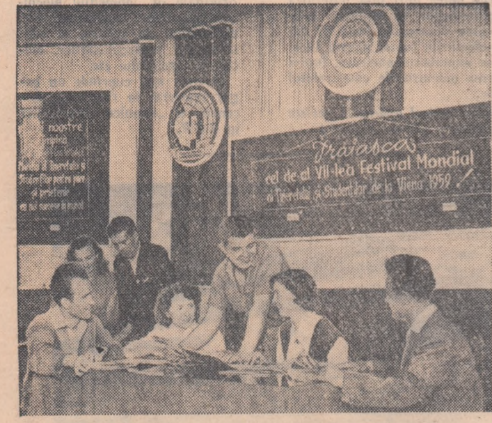
Cu gîndul la Viena, locul unde se va ține în acest an cel de-al VII-lea Festival Mondial al Tineretului și Studenților, tinerii de la Uzinele „23 August” din Capitală și-au organizat în clubul uzinelor „Colțul Festivalului”.