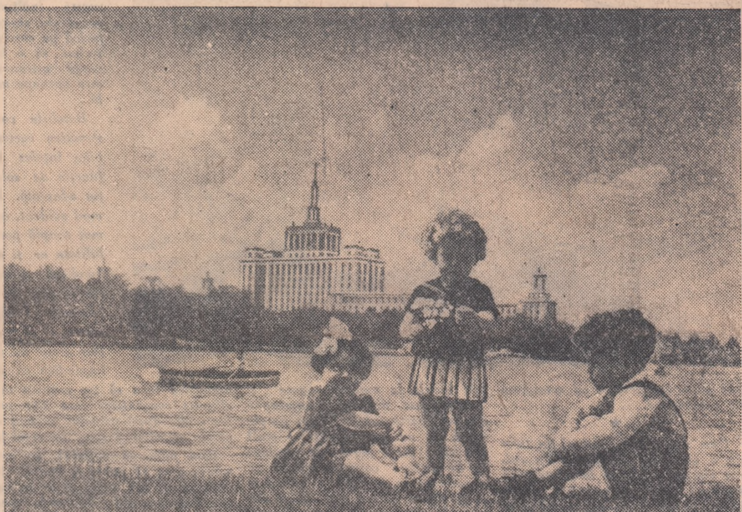
Odihna în parc

PETRU PEPELEA activist al Comitetului raional U.T.M.—Pașcani