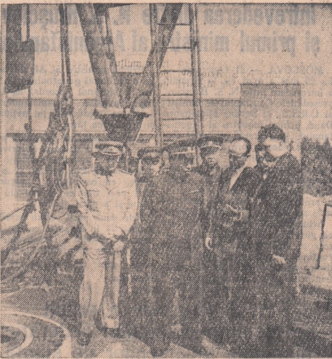
Oaspeții chinezi la Uzinele „1 Mai” din Ploiești