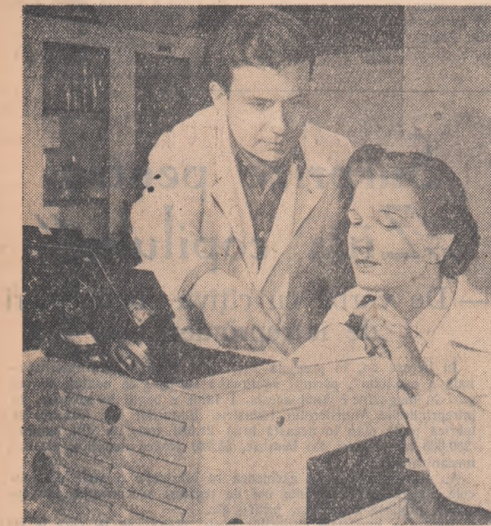
„Fenomene electrice din atmosferă“

Înaintea de a evidenția câteva din problemele și semnificațiile pe care le prezintă Monografia geografică a R.P.R., trebuie să subliniem în primul rând aportul pe care l-au adus în întocmirea acestei lucrări specialiștii sovietici care, începând cu participarea lor la cercetările întreprinse pe teren și terminând cu ajutorul științific substanțial pe care ni l-au dat en primele discu-