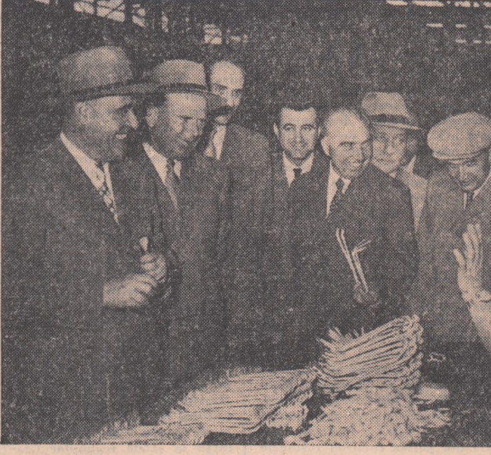
Conducătorii ai partidului și statului în vizită la Uzinele „Electroputere”