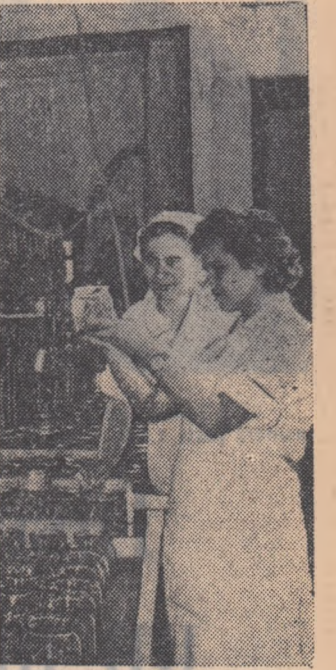
La întreprinderea „Flora” din Capitală a început fabricarea conservelor din noua recoltă de legume