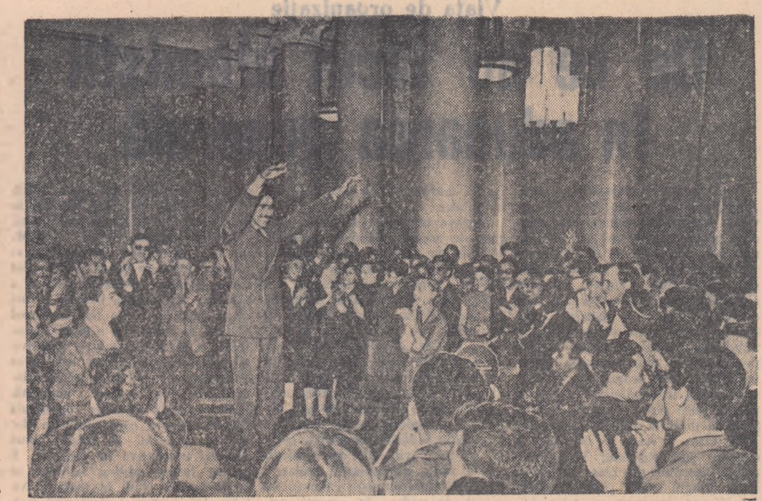
La Casa de cultură a Universității din Moscova a avut loc o reuniune unde au participat tineri și tinere din 27 de țări care studiază la Moscova. În fotografie: Un aspect din timpul reuniunii.