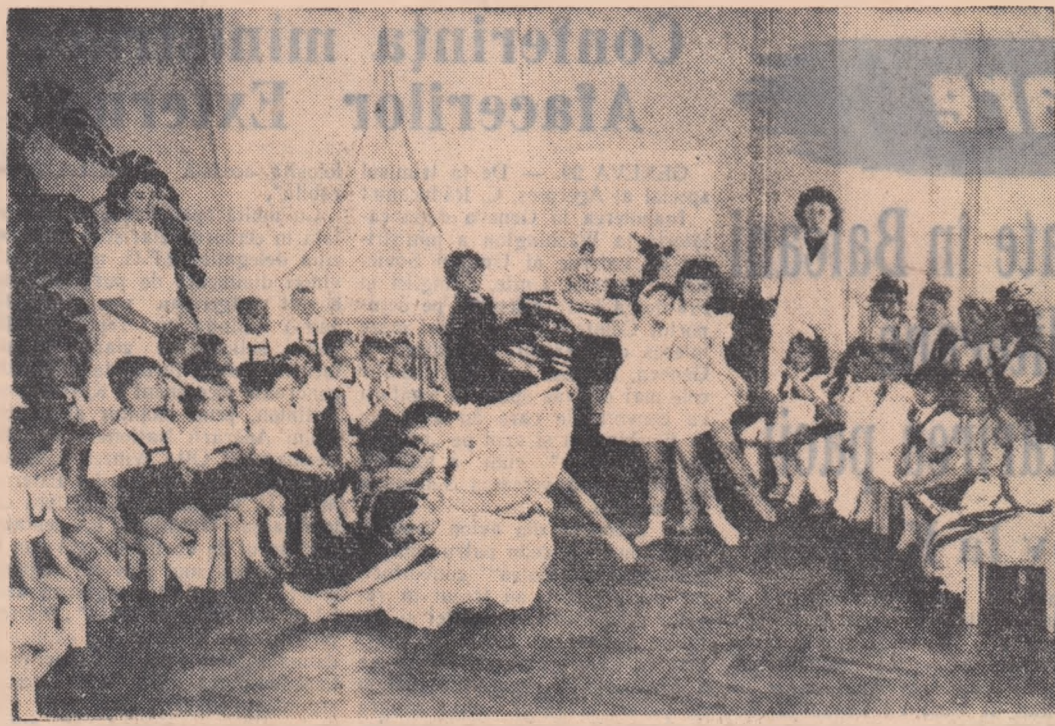
Copiii muncitorilor de la tipografia „Bela Breiner” din Oradea, pregătesc un frumos program artistic pentru serbarea ce o vor da în cinstea Zilei internaționale a copilului.