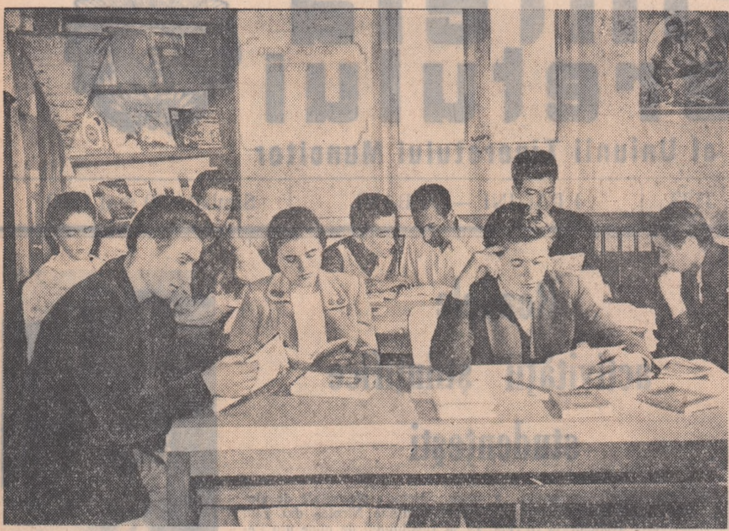
În comuna Ștefănești, raionul Pitești, funcționează o bibliotecă cu 6.000 volume. În prezent ea numără peste 1.400 cititori. În fotografie: un aspect din sala de lectură.