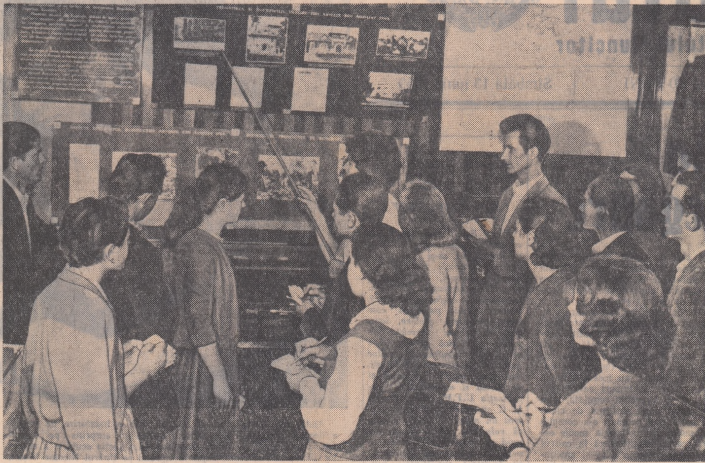
Un grup de tineri de la Întreprinderea „Kirov” la Muzeul de istorie a orașului București, studiind documentele privind insurecția de la 23 August 1944.