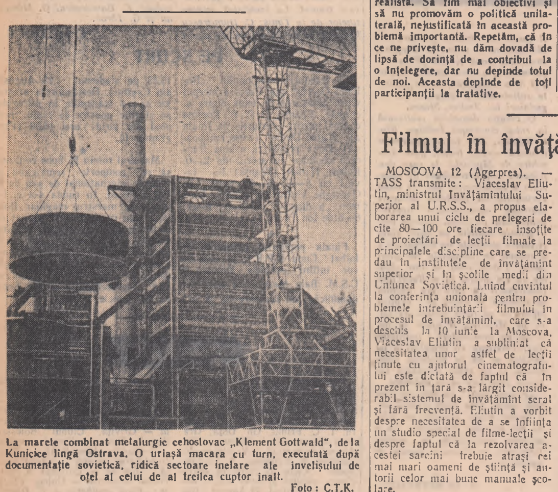
La marce combinat metalurgic cehoslovac „Klement Gottwald“, de la Kunicke lângă Ostrava. O uriașă macara cu turn, executată după documentație sovietică, ridică sectoare înelare ale invelisului de oțel al celui de al treilea cuprot inalt.

mediteraneană — subliniază ziarul în încheiere — ca și cele ale popoarelor din întreaga lume, impun coexistența pașnică și reglementarea problemelor internaționale pe calea tratativelor. Dacă guvernele italian și grec prețuiesc pacea și interesele propriilor lor popoare, atunci ele nu au nici un motiv și nu pot invoca nici un pretext pentru a respinge propunerile rezonabile ale Uniunii Sovietice și ale țărilor socialiste din Peninsula Balcanică.