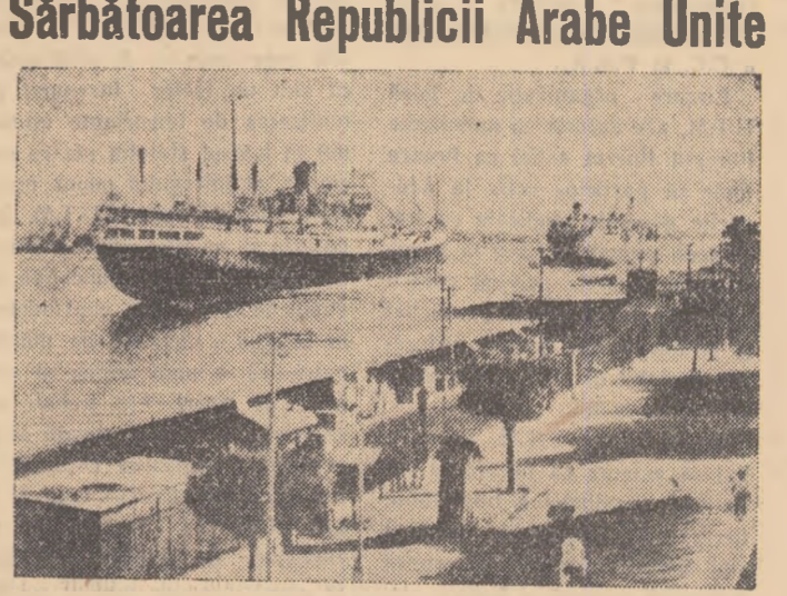
Pe Canalul de Suez

Oamenii muncii din Polonia — a declarat N. S. Hruşciiov — au obţinut mari succese în transformarea patriei lor şi continuă cu mult entuziasm să construiască societatea socialistă. Prin aceasta ei îşi aduc contribuţia la cauza comună a întăririi puterii lagărului socialist. Dorim din toată inima participarea voastră la această cauză. Oamenii muncii din Polonia — a declarat N. S. Hruşciiov — au obţinut mari succese în transformarea patriei lor şi continuă cu mult entuziasm să construiască societatea socialistă. Prin aceasta ei îşi aduc contribuţia la cauza comună a întăririi puterii lagărului socialist. Dorim din toată inima participarea voastră la această cauză.