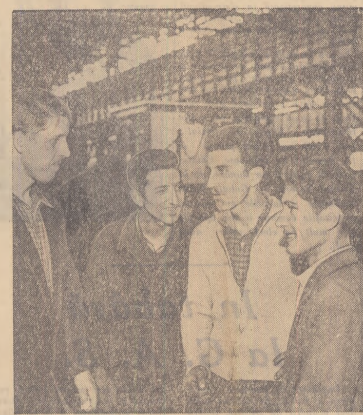
In curînd, la București

duse de larg consum, care au adus populației o economie anuală de circa 500.000.000 lei.