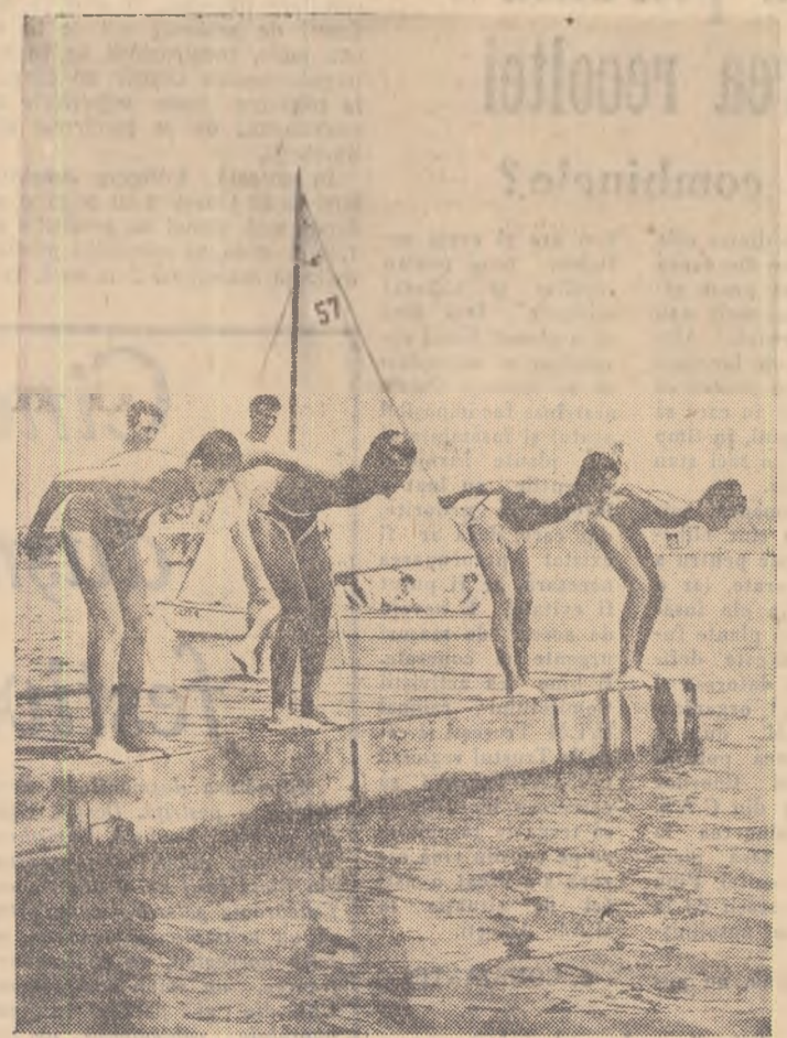
Aer, soare, sport. De toate acestea se bucură și elevii școlilor medii aflați în vacanță.