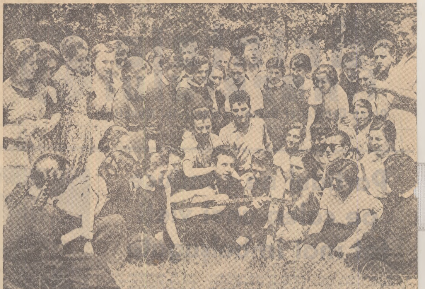
În tabăra elevilor școlilor medii ale regiunii București, deschisă în comuna Brănești — așa cum arată fotografia noastră — elevii știu să-și petreacă în mod plăcut orele libere.

Intre două școli obștjene — Școala medie nr. 9 și Școala medie nr. 12 cu limba de predare maghiară — s-au stabilit, încă din timpul anului școlar, relații de strinsă prietenie și colaborare. Elevii au desfășurat o activitate comună concertată în simpozionul literar „Ady Endre”, „Mihail Beniuc” și programul artistic care a urmat. Pentru vacanță, comitetele U.T.M. ale celor două școli au planuit și organizat o excursie prin toată țara. Două vagoane de tren vor găzdui pe elevii celor două școli care timp de două săptămâni vor vizita Hunedoara, Reșița, Bucureștiul; cele 4 zile pe litoral vor să fie deosebit de frumoase. Călătorind cu vaporul pe Dunăre, de la Turnul Severin la Galați, Delta, întinirile și locurile noi văzute, activitățile comune îi vor apropia mai mult pe elevii celor două școli.