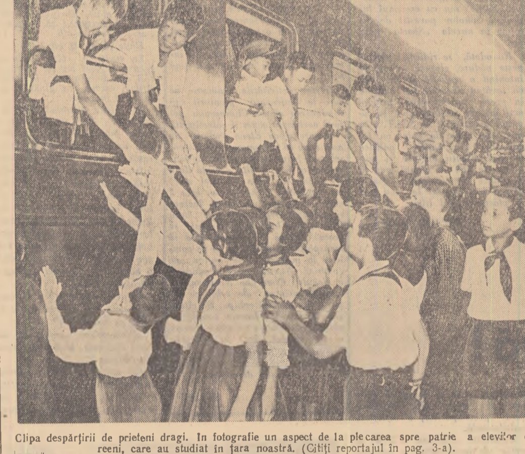
Clipea despărțirii de prieteni dragi. În fotografie un aspect de la plecarea spre patrie a elevilor coreeni...

Una din săptămînile trecute a fost declarată de către uniștii din comuna Gorban, raionul Huși, săptămîna colectării fierului vechi.