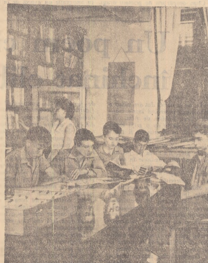
Cîte țaine ascund filele cărților... În zilele vacanței în clubul „Construcțiilor” elevii școlilor medii din raionul „Marș-București” cîțesc lucrări aparute în ultima vreme în literatura științifică și beletristică.