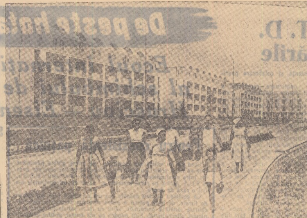
Vedere asupra noului complex de case de odihnă de la Mangalia