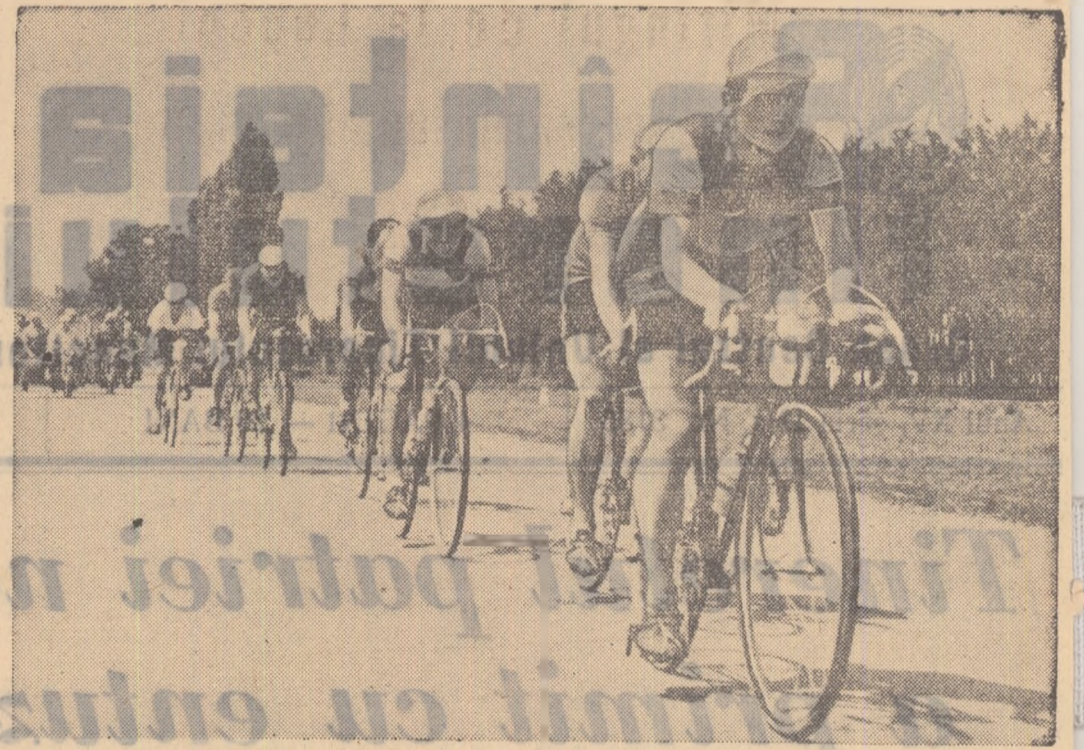
Aspect din campio natul republican de fond, cursa rezervată seniorilor.

☆ În R. P. Polona echipele reprezentative de handbal (tineri) ale țării noastre au susținut o dublă întîlnire (masculin și feminin) cu selecțiile R. P. Polone. Ambele întîlniri au luat sfîrșit cu victoria echipelor noastre. La fete scorul a fost de 7-3, iar la băieți 14-9.