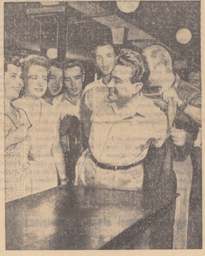
Incă de ieri, magazinele cu mărfuri de larg consum cunosc o afinență neobișnuită. Iată în fotografie mai mulți cumpărători la raionul de confecții al magazinului „Victoria”