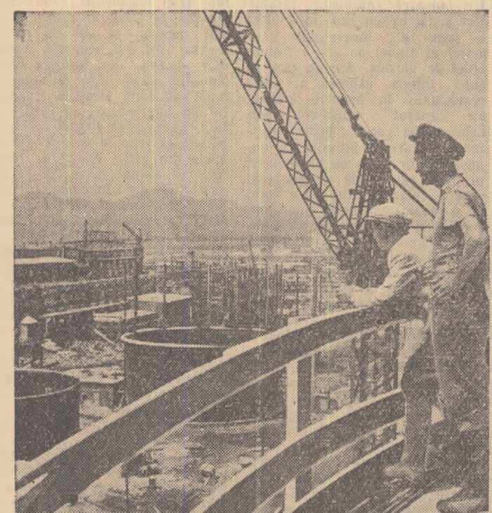
Construcții de pe șantierul Roznov, unde se ridică cel mai mare combinat de îngrășăminte azotose din țara noastră, depun eforturi pentru grăbirea lucrărilor de construcție. Pe șantierul îl al Fabricii deacid azotic se lucrează la construirea turnurilor de granulare. În fotografie: Aspect de pe șantierul de construcții Roznov.

Noaptea, după demachiaj, după stringerea colegială a mînilor, maestrul se întoarce acasă. Ostenita, pe cît de anevoiasă, e că partidul nostru a dat filozofii săi oca polivalentă spirituală de care nici o altă putere din lume nu s-a arătat capabilă.