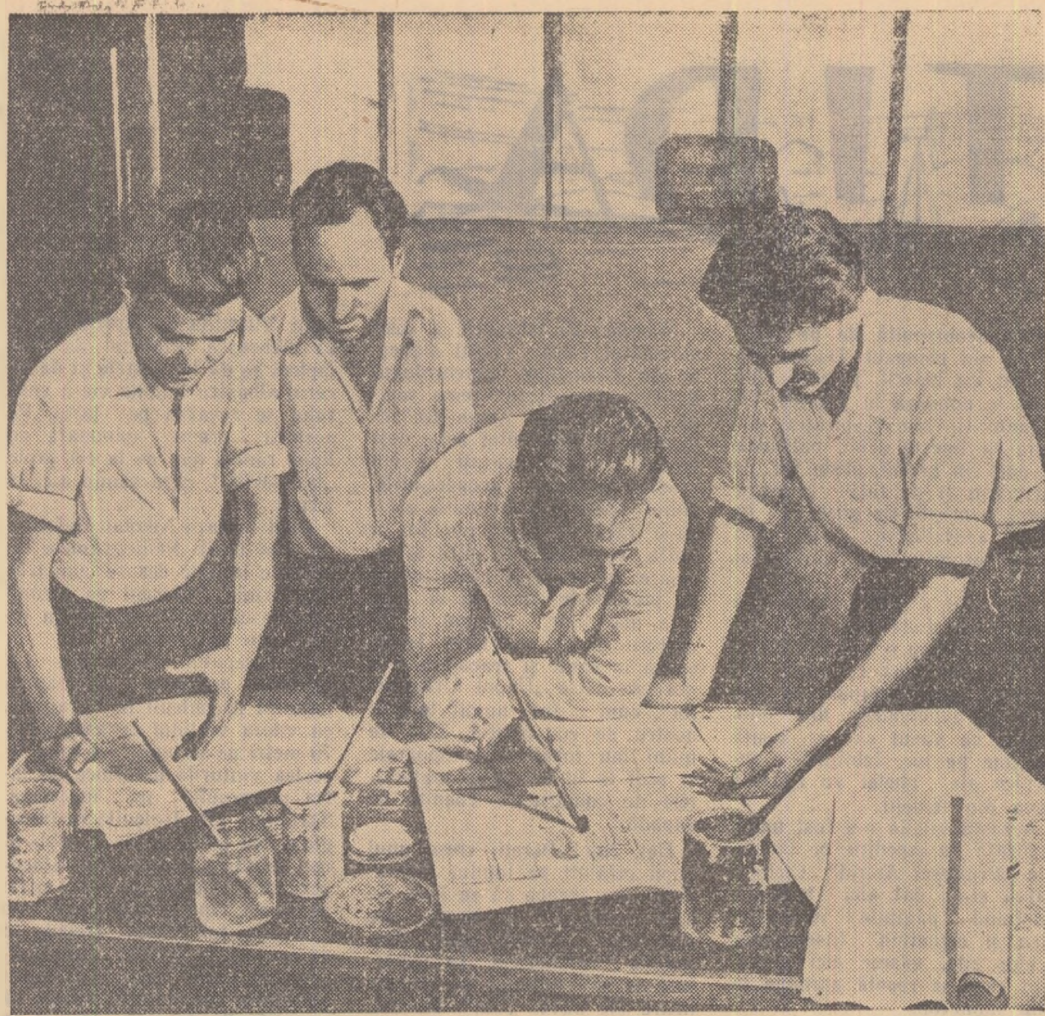
Postul utemist de control din secția motoare a Uzinelor „Ernst Thälmann din Orașul Stalin desfășoară o susținută activitate, combătînd prin raidurile efectuate lipsurile livrite în munca tinerilor. În fotografie: membrii postului utemist de control elaborează un nou număr al gazetei lor.