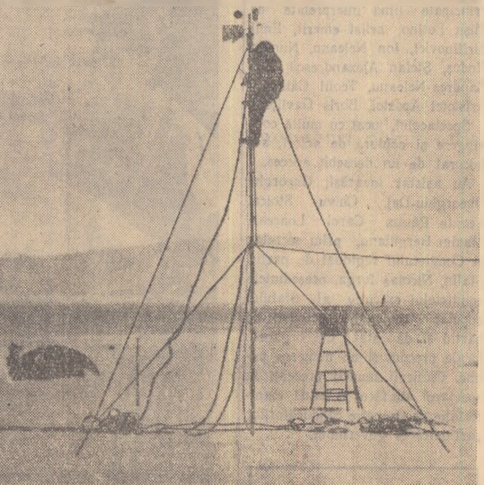
Exploratorii au început să-și instaleze stația de cercetare în imensitatea albă.

Mulțumim lazareviștilor. Să vă întoarceți acasă sănătoși și cu un bogat bagaj științific!