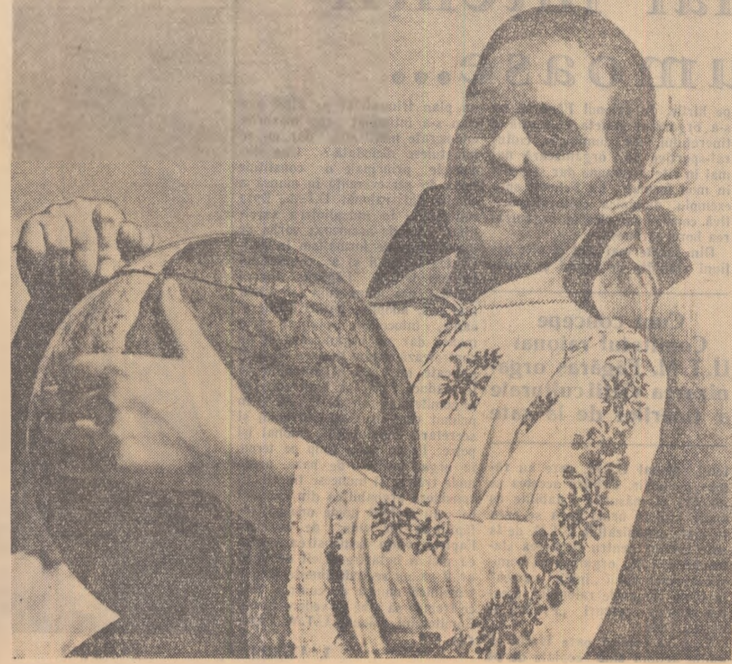
Din noua recoltă de OSMULCHEVICI ARCADEIE (Din expoziția de fotografii artistice „Pe drumul socialismului”).

Petele cu baze de acizi metalici. Petele de cerneală de pe orice haină se pot scoate astfel: se înmoaie pata mereu într-un vas cu lapte fierbinte care se ține pe măriș. Cînd lăptela se colorază se schimbă. Sau se așează pata pe o cîrpă curată, se storce deasupra zeamă de lămîie caldă, se așează o altă cîrpă deasupra și se trece cu fierul de călcat cald.