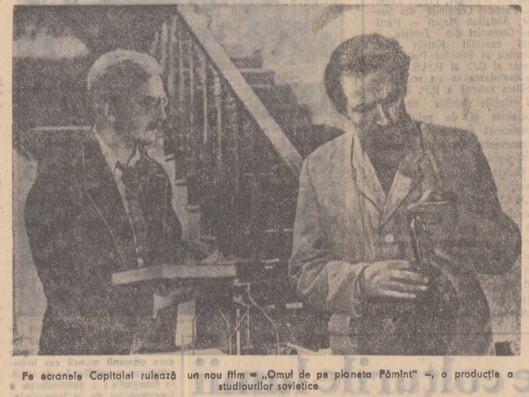
Pe ecranele Capitalei rulează un nou film — „Omul de pe planeta Pămînt” — o producție a studioului sovietic