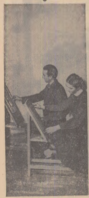
Școala populară de artă din Oradea, atrage numeroși tineri.