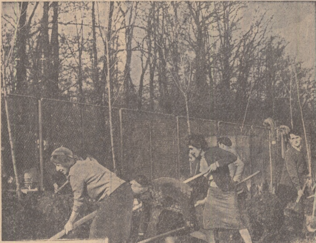
Răspunzînd chemării brigăzilor utemiste de muncă patriotică din orașul Craiova, tinerii de la Institutul de fizică atomică și din cadrul Academiei R. P. Romîne, au luat sub patronajul lor amenajarea parcului zoologic din pădurea Băneasa. În fotografie: tinerii din brigăzile utemiste de muncă patriotică de la cele două instituții la lucru.

De la chemarea tinerilor craioveni au trecut puține zile. Tinerii brigadierii de la Uzinele „Mao Tze-dun” au și ieșit la muncă patriotică dornici de a traduce în fapte angajamentul luat cu acest prilej. Ca de obicei, în zilele când au ieșit la muncă n-a lipsit nici un linar din brigadă. Fiecare dorea să dea o mână de ajutor la amenajarea hălei de lucru de la Uzinele. Au lucrat până acum circa 140 de ore. În acest timp au colectat din uzină și 4.000 kg. fier vechi. După ce au terminat munca, ca de obicei, tinerii brigadierii au cîntat. De data aceasta au învățat cîntecul „Sub steagul partidului”. De altfel în angajamentele brigăzii luate în cinstea zilei de 30 Decembrie sînt prevăzute și alte puncte importante care sînt ducă la întărirea spiritului colectiv, la îmbogățirea cunoștințelor politice și culturale ale membrilor brigăzii. De aceea, tinerii brigadierii nu s-au mărginit numai să lucreze la muncă patriotică. Au organizat în colectiv și unele acțiuni culturale. Printre altele, de curînd, tinerii din brigadă au vizionat în colectiv spectacolul „Răzvan și Vidra” la Teatrul Municipal. C. M.