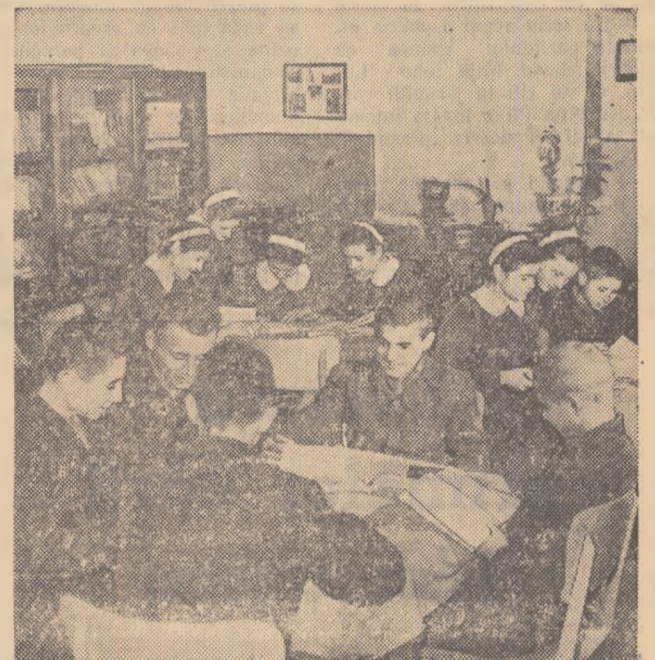
Elevii își petrec o bună parte din timp în sala bibliotecii. Aici studiază lucrări de ideologie, beltristică, știință, tehnică, ziare etc.