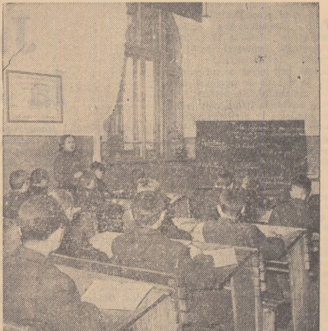
Oră de curs. Elevii își însușesc pe lingă materiile de specialitate și o serie de materii de cultură generală.

Aspecte din viața și activitatea elevilor Școlii de meserii din Bacău