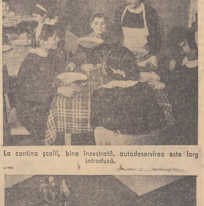
La cantina școlii, bine înzestrată, autodeservirea este larg introdusă.