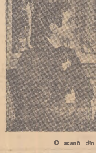
O scenă din filmul „Mizerabili”