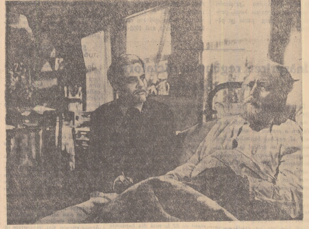
O scenă din filmul „Omul de pe planeta Pămînt”