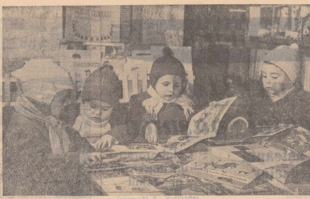
La „Librăria copiilor” din b-dul Magheru cei mici găsesc acți cărți după gustul lor.

Am fost de față Janusz Zambrowicz, ambasadorul R.P. Poine la București și membri ai ambasadei. (Agerpres)