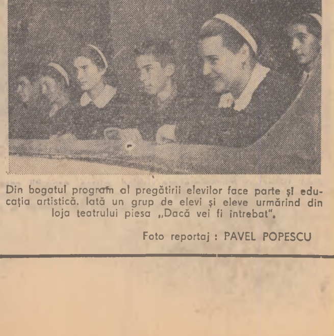
Din bogatul program al pregătirii elevilor face parte și educația artistică. În fotografia noastră un grup de elevi și eleve urmînd din loja teatrului piesa „Dacă vei fi întrebata”.