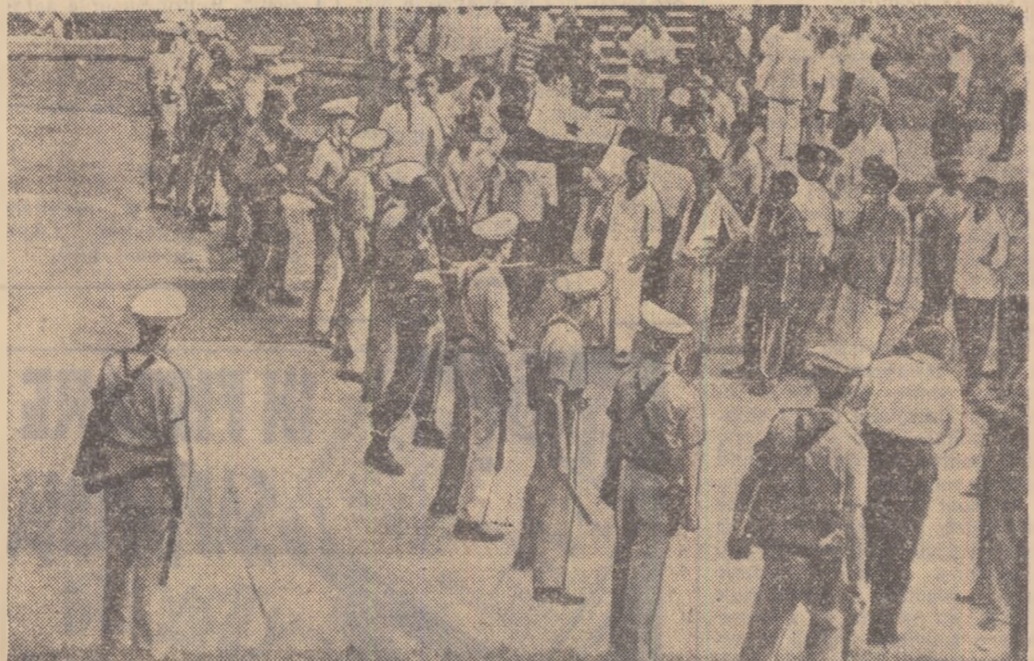
Recent au avut loc în Panama puternice demonstrații anti-americane prin care panamezii cereau dreptul de suveranitate națională asupra Canalului Panama, ocupat în mod ilegal de către trupele S.U.A. În fotografia noastră puteți vedea o intervenție a trupelor americane împotriva demonstrațiilor panameze, care se îndreptau spre zona Canalului Panama, pentru a ridică acolo drapelul național.