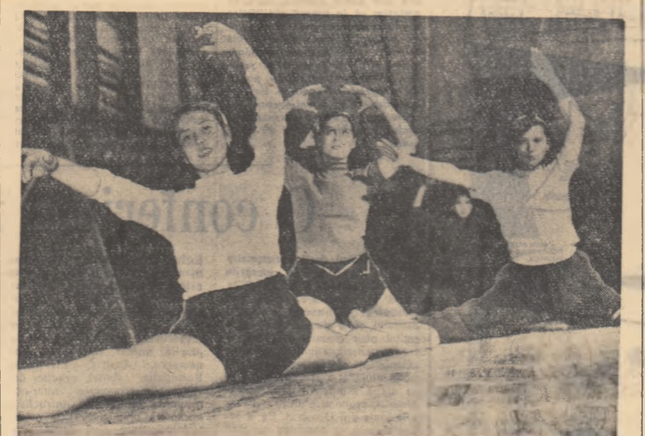
În ora de gimnastică, la Școala medie nr. 2 din Brăila