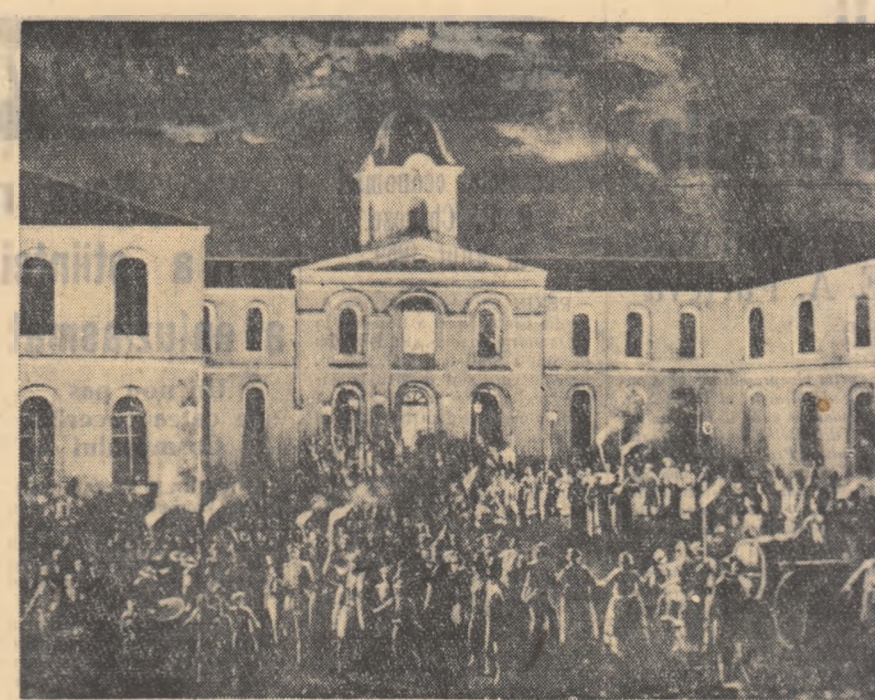
Th. Aman: Hora Unirii la Culoava.

Aplicind în viața cu profunzime și consecvență sarcinile importante reșcite din documentele Plenarilor a V-a și a VII-a ale C.C. al U.T.M. vom contribui la dezvoltarea și mai puternică în rindul pionierilor a dragostei fierbinți față de patrie, față de partid și față de clasa noastră muncitoare, a dorinței de a și dovedi recunoștința pentru viața fericită pe care o trăiesc astăzi în patria noastră, învățind cu harnică și siguranță, însușindu și temeinic deprinderi practice, pregătindu-se cu seriozitate pentru munca viitoare pe frontul construcției socialiste.