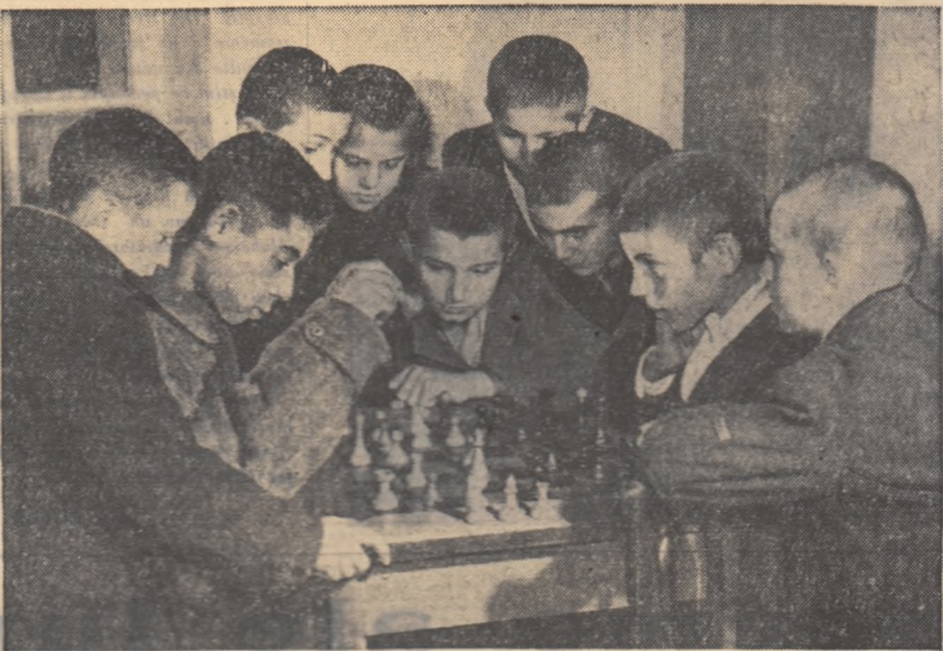
Cine știe dacă în viitor unul din „pici” șahiști, care seară de seară își dispută partide la clubul Fabricii de rulmenți din Bihăd, nu va urma podiumul campionilor la un concurs internațional.

ÎN ZILELE URMĂTOARE, ORGANIZAȚIILE U.T.M. TREBUIE SĂ INTENSIFICE MUNCA POLITICO-EDUCATIVĂ, ORGANIZIND NOI ACȚIUNI DE COLECTARE A FIERULUI VECHI, ATRĂGIND CIT MAI MULȚI TINERI LA ACEASTA MUNCA PATRIOTICĂ DEOSEBIT DE IMPORTANTĂ PENTRU ECONOMIA PATRIEI.