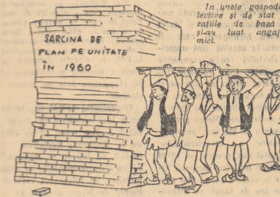
Acesta este angajamentul nostru!

Pentru a asigura o bază furajeră îndestulătoare, colectivștii din Valea Stăncuții, raionul Segarcea, au hotărît să cultive cu porumb pentru siloz 120 de hectare. Cu 70 hectare mai mult ca anul trecut. Din această suprafață, 10 hectare vor fi irigate de care este prevăzută să se obțină 120.000 kg. porumb-siloz la hectar. Prin însilozarea acestor plante, colectivștii din Valea Stăncuții au hotărît să asigure pentru fiecare cap de vită mare 14 tone de nutreț murat. Toate aceste hotărîri au fost luate în urma propunerilor făcute de către organizația de partid. Utemiștii și tinerii au hotărît ca la îndeplinirea acestor importante sarcini să contribuie și ei, cu toate forțele în acest scop biroul organizației de bază U.T.M. a convocat o adunare generală deschisă. Pe marginea fiecărei sarcini de producție prevăzută pentru sectorul zootehnic în planul gospodăriei tinerii au purtat discuții aprinse. Apoi, adunarea generală a hotărît să ceară conducătorilor gospodăriei ca tinerii să ră-pundă de 50 de hectare cu porumb siloz, să efectueze toate lucrările pe 5 din