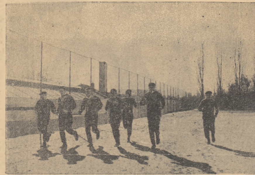
Pregătirea fizică în aer liber a boxerilor pentru jocurile olimpice de la Roma.

N. PUIU corespondent „Scînteia tineretului” pentru regiunea Ploiești