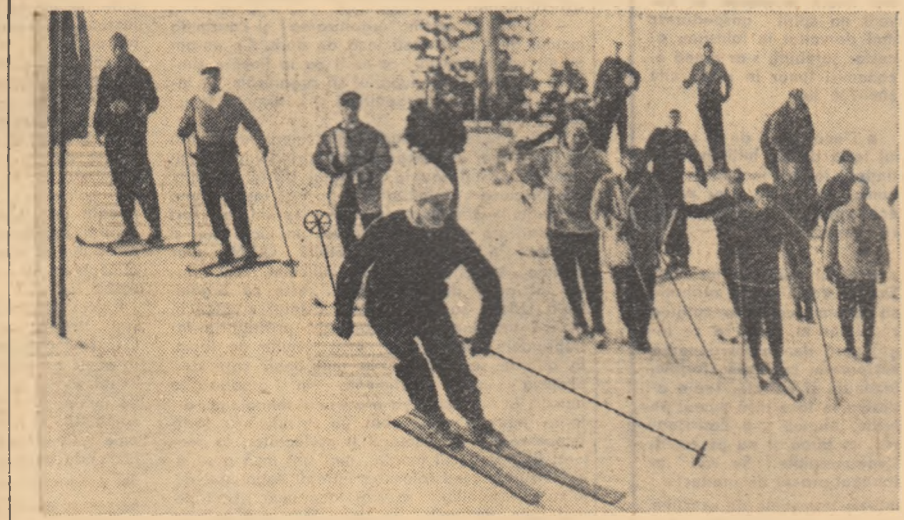
Tinerii schiori români participanți la „Cupa Speranțelor” s-au afirmat încă din prima zi a intrărilor. Comportîndu-se excelent în toate probele ei au reușit să cucerească trofeul acestui valoroase competiții internaționale. Fotografia noastră redă o imagine din proba: slalom-ul.