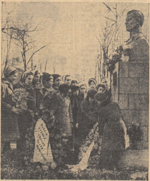
Un grup de pionieri de la Școala de 7 ani nr. 25 din raionul „1 Mai” București depun coroane de flori la monumentul lui Vasile Roaită de la Atelierele de locomotive și vagoane C.F.R. „Grivița Roșie”.