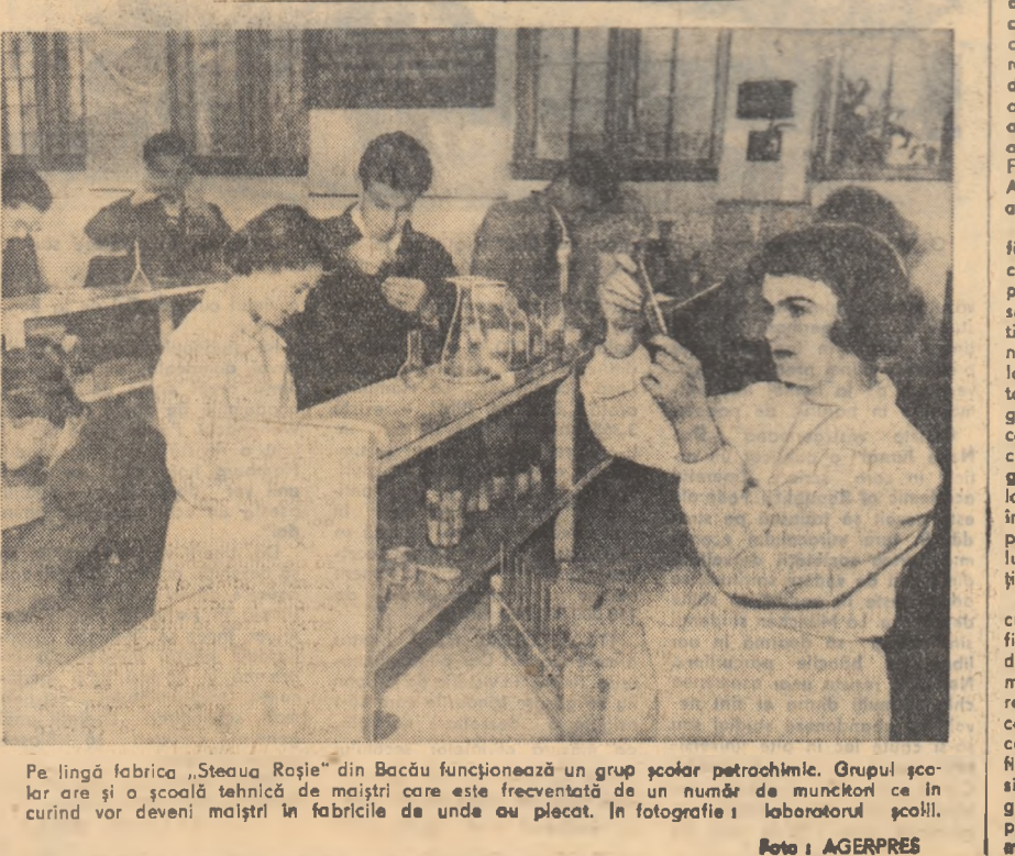
Pe lângă fabrica „Steaua Roșie” din Bacău funcționează un grup școlar petrochimic. Grupul școlar are și o școală tehnică de maștri care este frecventată de un număr de muncitori ce în curînd vor deveni maștri în fabricile de unde au plecat. În fotografie: laboratorul școlii.