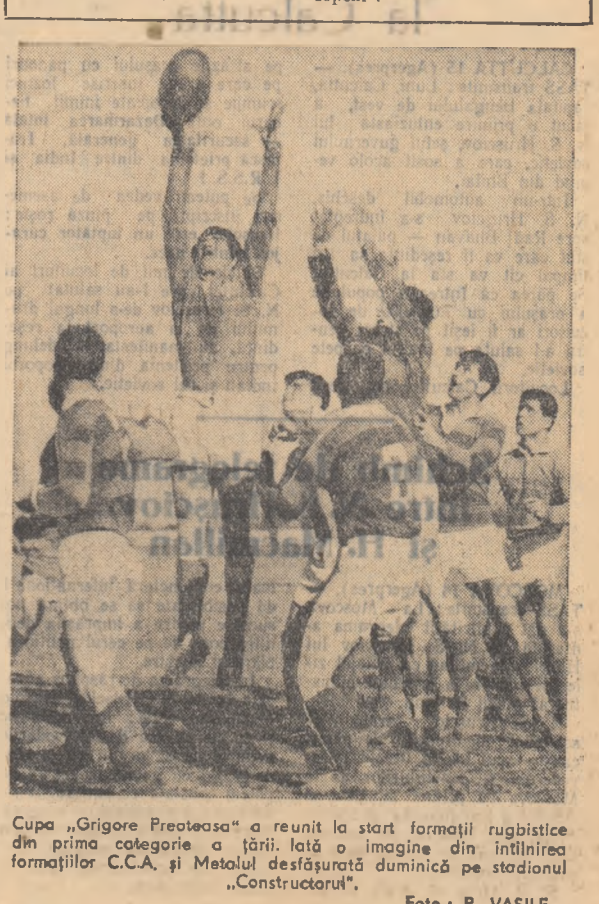
Cupa „Grigore Preoteasa” a reunit la start formații rugbistice din prima categorie a țării. Iată o imagine din întâlnirea formațiilor C.C.A. și Metolul desfășurată duminică pe stadionul „Construcătorul”.

După victoria cu 3-0 de la Lausanne, asupra echipei elvețiene E.O.S., voleibalistii de la Rapid au reușit să cucerească victoria și la București. Scorul de 3-0 dovedește pe deplin valoarea voleiului nostru față de cel elvețian. Rapid București s-a calificat astfel pentru turul următor al „Cupei Campionilor Europeni”.