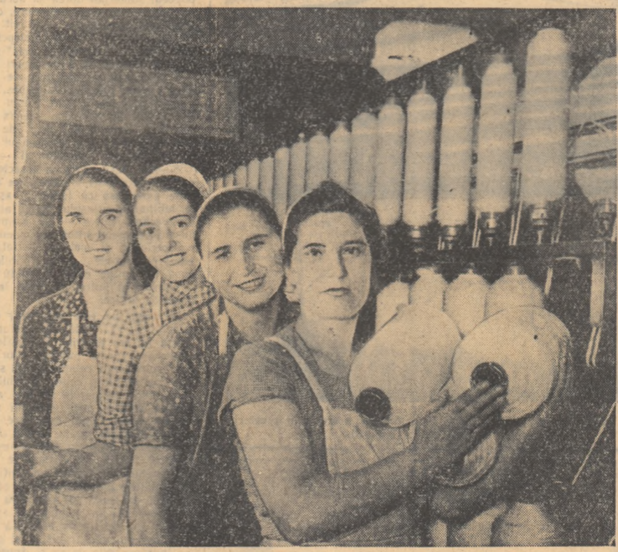
În fotografie: frunzele în producție din secția fierului „Bumbăcării Jilava”.