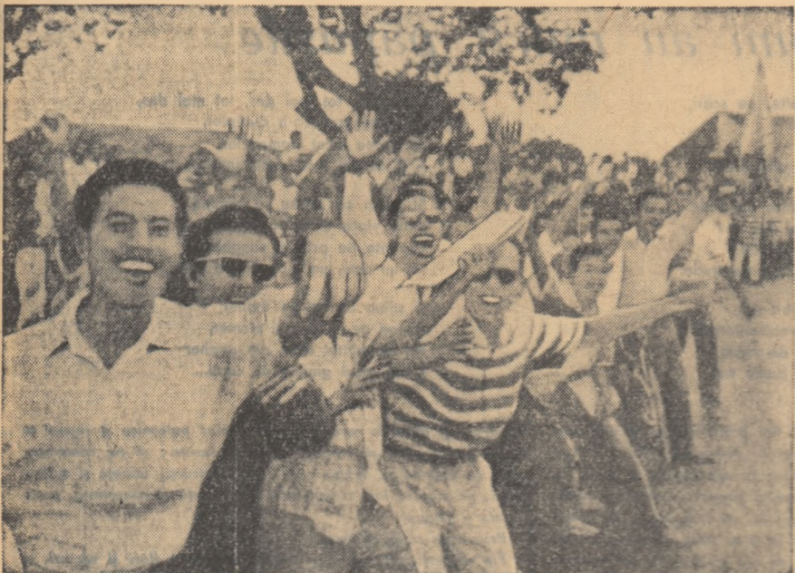
În toate orașele Indoneziei precum și în sate, milioane de oameni ei muncii i-au salutat cu entuziasm pe inculțul oaspete sovietic - N.S. Hrușciov.

DIJAKARTA 27 (Agerpres). — Coronerul special: Până la 1 martie, clădirea va fi vizitată de N. S. Hrușciov în Indonezia, el urmînd să plece la Calcutta unde va avea o nouă întrevedere cu premierul indian, Nehru, și de acolo în Afganistan, programul șefului guvernului sovietic cuprinde continuarea tratativelor cu președintele Sukarno la Bogor, precum și o