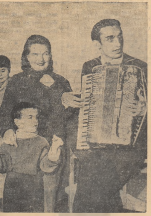
În timpul unui turneu prin comunele regiunii Craiova, membrii Ansamblului de cîntec și dansuri populare „N. Bălcescu” s-au oprit pentru o scurtă reprezentare și la Casa copilului din comuna Roșietea.