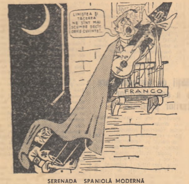
SERENADA SPANIOLE MODERNĂ Desen de M. Abramov, din ziarul „Pravda”

În primul timp Editura Lehman din München a lansat o adevărată campanie de publicitate pentru o colecție de „opere” proslăvînd acțiunile criminale ale trupeilor hitleriste în timpul celui de-al doilea război mondial. Colecția se întîlnește „Oamenii și acțiunile și cu subtitlul „Cavalerii crucii de fier poartese”. O publicitate moștră s-a făcut cărții „Asaltul asupra orașului Tula” în care sînt preamărite faptele criminale ale regimului lui Hitler în fața lui în timpul ocupației. Imediat după apariția acestei colecții a surdit „cavalerii crucii de fier” și-au prezentat „creațiile” alturii.