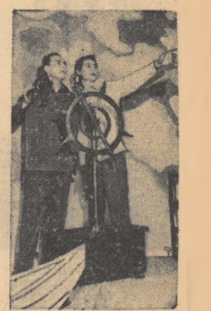
Scenă din piesa „Cu dragostea nu-i de glumit” a cărei premieră a avut loc recent la Teatrul de Stat din Bacău.

Pentru ajutorarea sinistraților în urma cutremurului de la Agadir, Crucea Roșie a R. P. Romine trimite Semilunii Roșii marocane medicamente, alimente și altele materiale de primă necesitate.