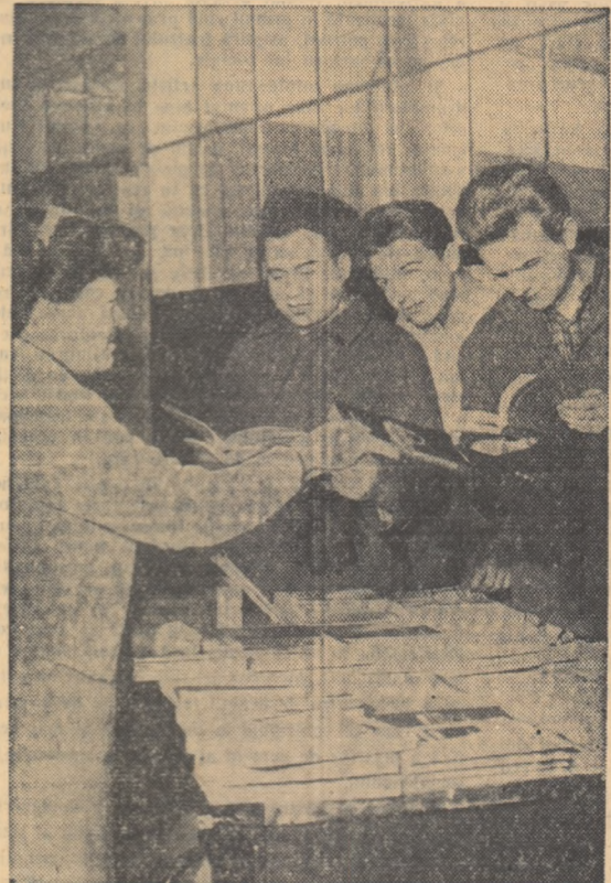
La standul de cărți al Uzinelor I.O.R.

Cîteva întrebări pe o temă de cultură de masă