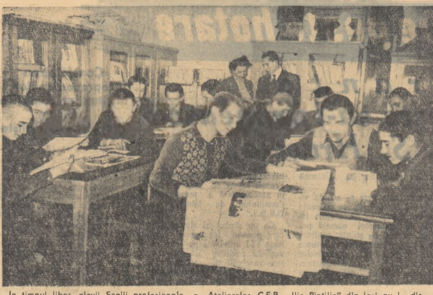
In timpul liber, elevii Școlii profesionale a Ateliereilor C.F.R. „Ilie Pintilie“ din Iași au la dispoziție, în cămin, o bogată bibliotecă.