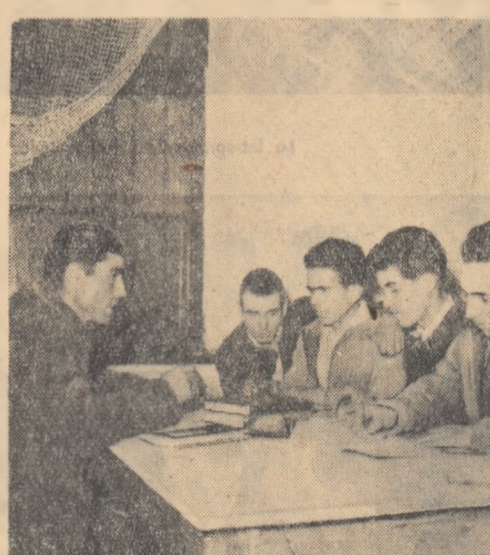
Pentru ca lucrările să se desfasoare într-adevăr bine, de echipă trebuie să ştie in fiecare seară ce e de făcut ziua. Intodeauna din discuţii cu el ies la iveală bune pentru muncă brigăzii.