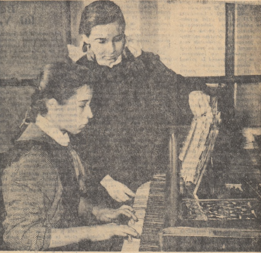
Un aspect de la cercul de pian al Palatului de cultură din Ploiești.