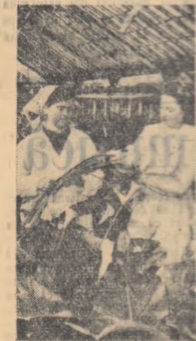
In serile G.A.S. Popeşti-Leordeni se recoltează calete.