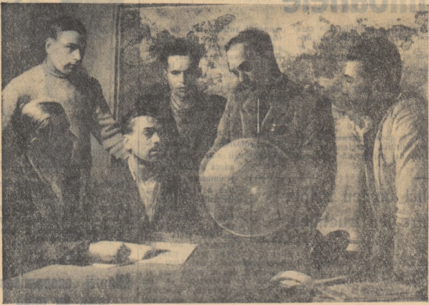
In cadrul cercurilor de cultura generala, colectivistii din G.A.C. „2 Octombrie” comuna Vinetor, regiunea Galati, lii imbogatesc cunoastintele.