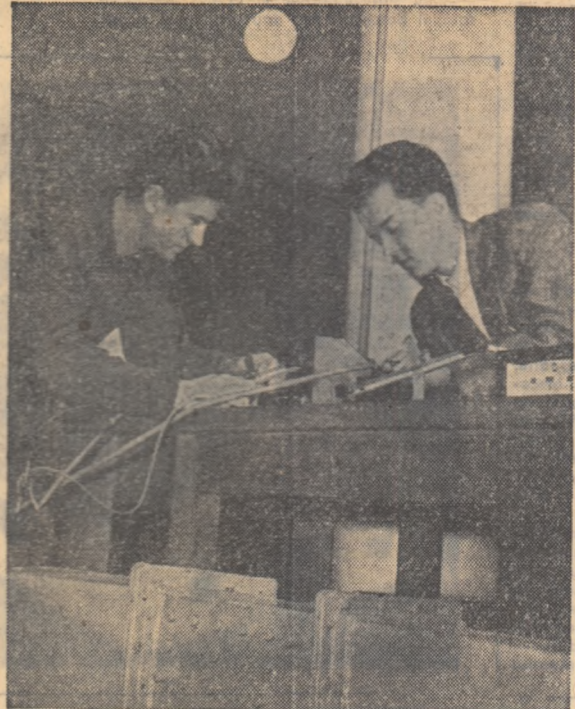
În cadrul cercurilor științifice de la Institutul Politehnic din Galați, studenții desfășoară o interesantă activitate. Iată doi studenți din anul IV mecanică, lucrînd la determinarea experimentală a rezistenței aerodinamice.