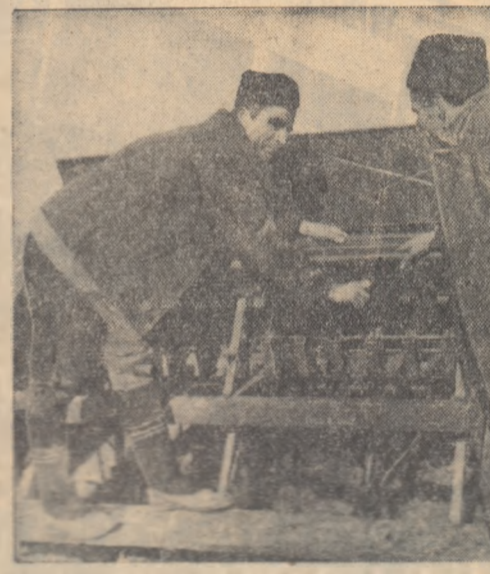
Însmînţatul trebuie să se facă la timp şi in cele mai bune condiţii. Brigadierul verifică semănătoarea, verifică de însmînţatul se face la distanţa şi la adîncimea optimă.